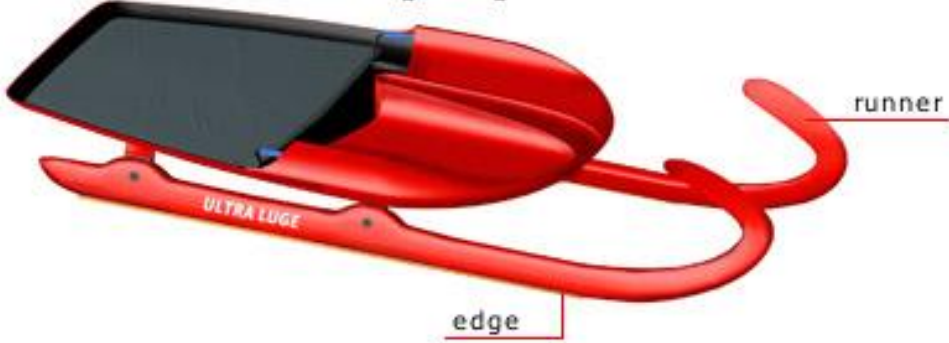
+ singles luge