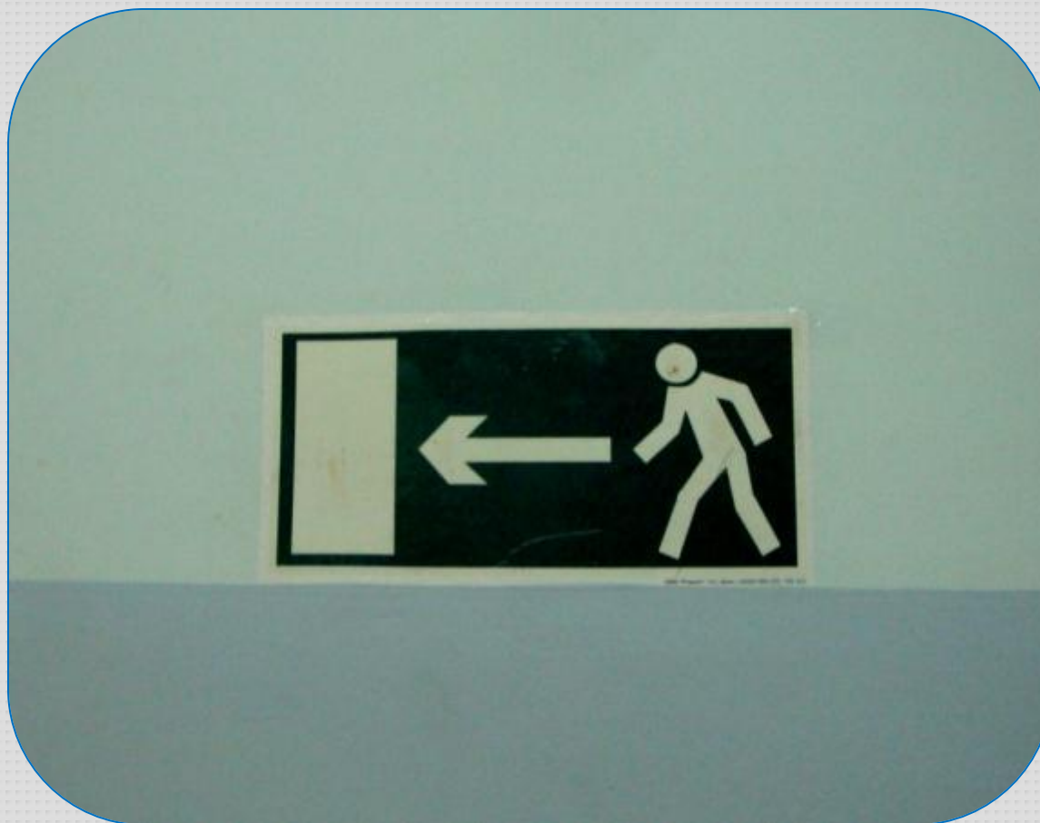
Опознавательный знак «Движение в данном направлении» при чрезвычайных ситуациях