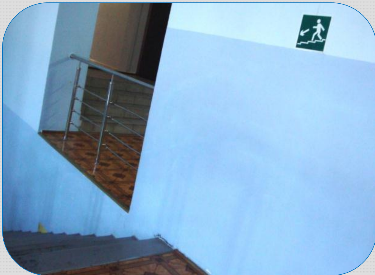
Опознавательный знак «Движение вниз по лестнице»