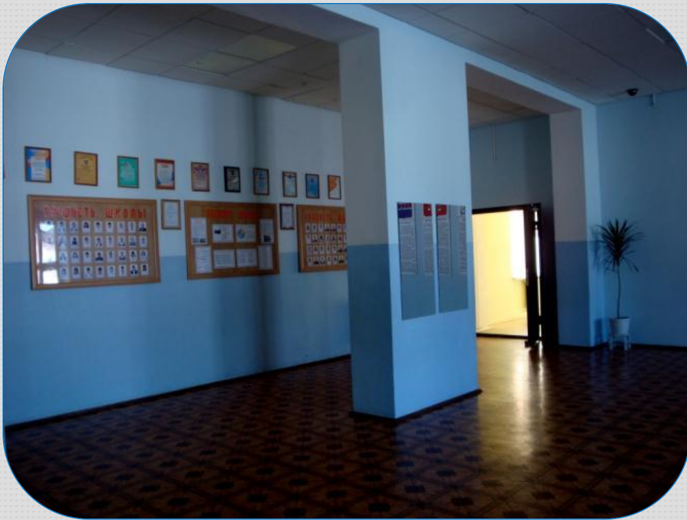
Фойе школы-интерната приглашает к дальнейшему знакомству