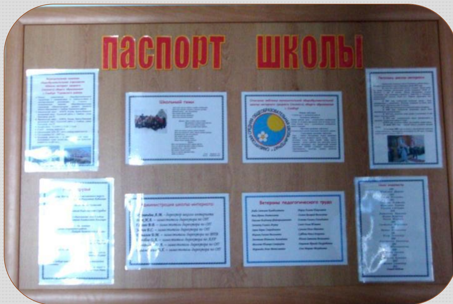
Есть свой паспорт школы: школьный гимн, символика