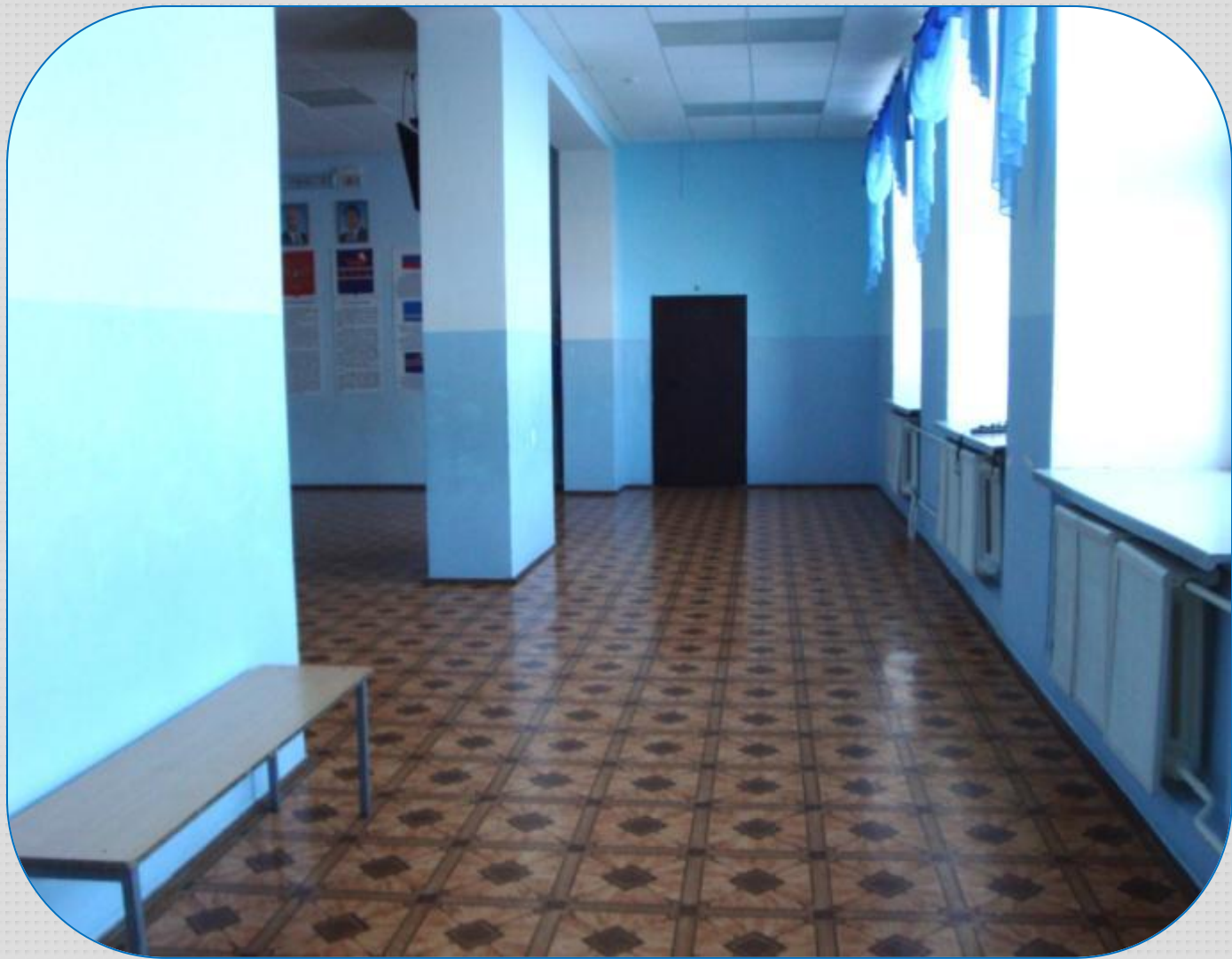
Место отдыха учащихся во время перемены