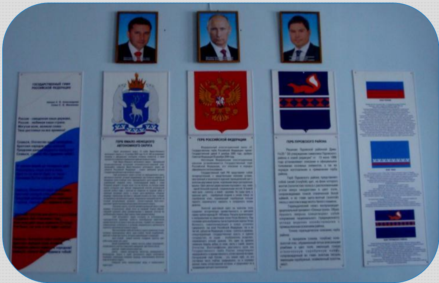
Лица государственной власти РФ, ЯНАО, Пуровского района Государственная символика