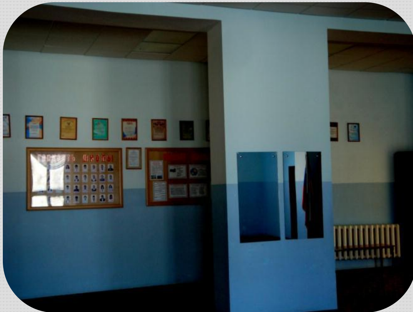
Фойе - большое, просторное и светлое место