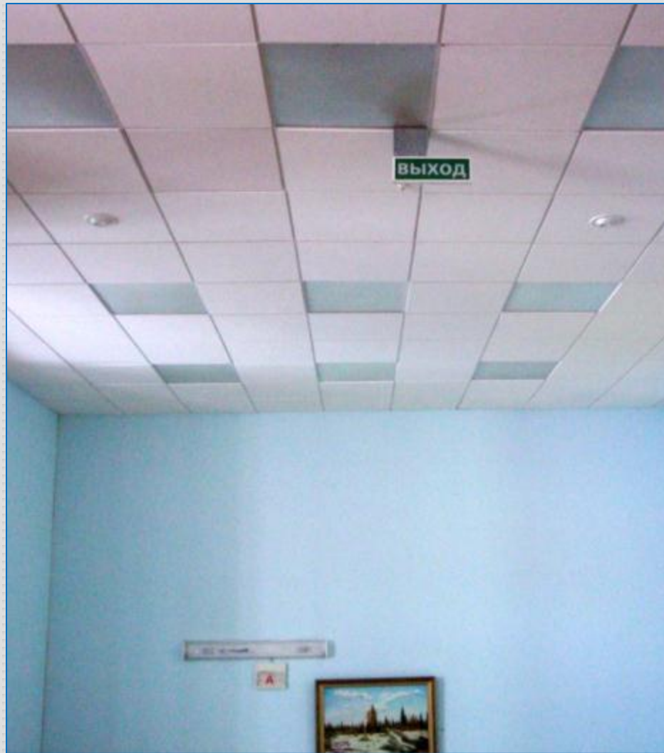
Опознавательный знак «ВЫХОД» при чрезвычайных ситуациях