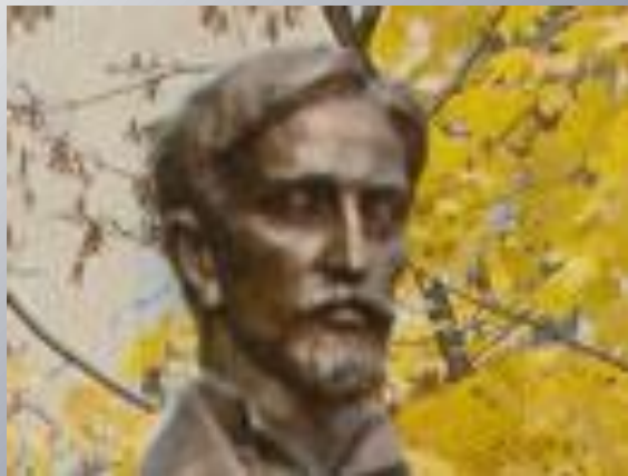
Бунин Иван Алексеевич