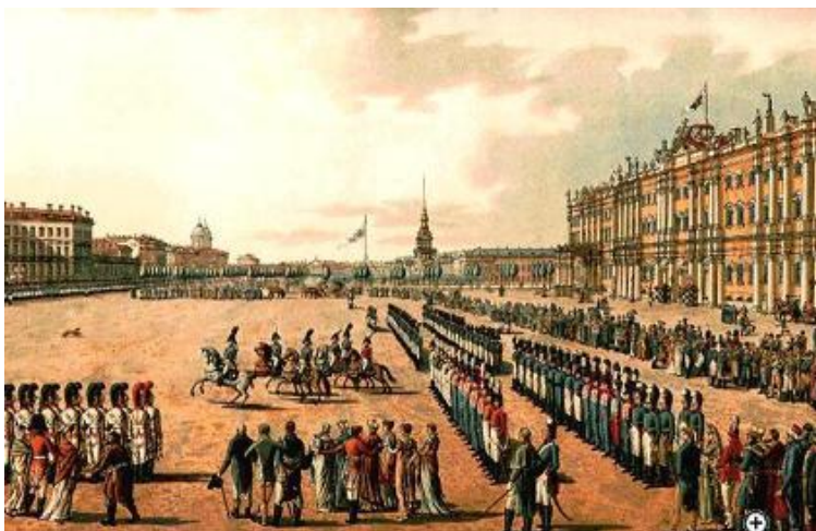
Вахт - парад на Дворцовой Площади В 1815 г.