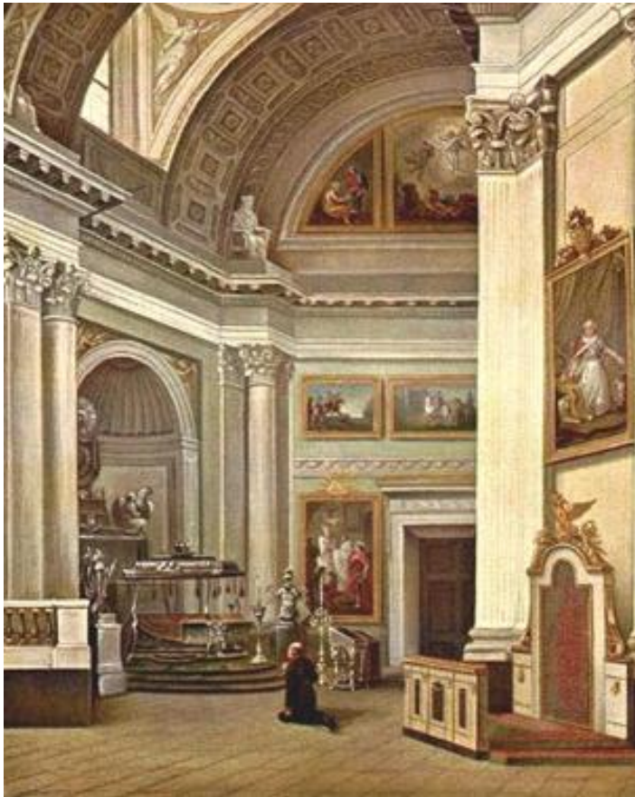
Александр I на молитве в Александро-Невской Лавре.