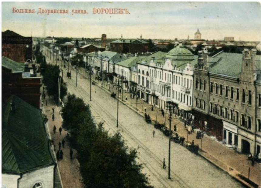
Большая Дворянская улица. ВОРОНЕЖЪ.