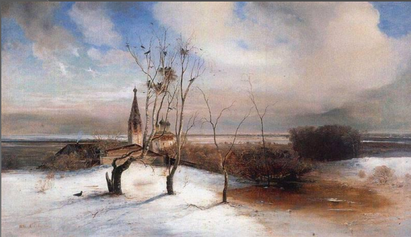
Саврасов А.К. «Грачи прилетели»