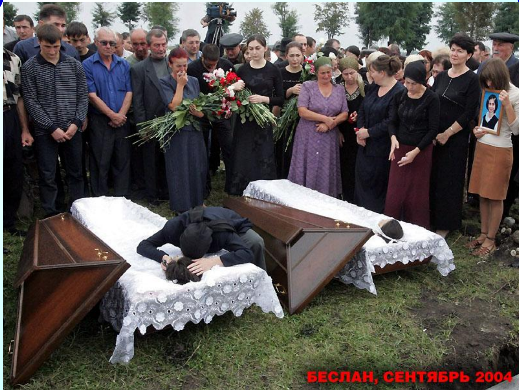
БЕСЛАН, СЕНТЯБРЬ 2004