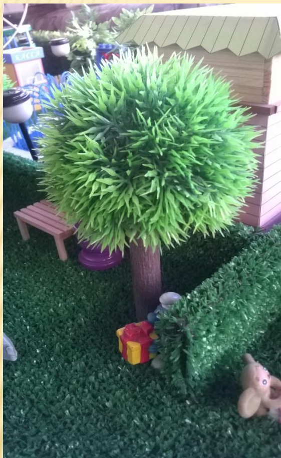
Клен остролистный 'Глобозум'