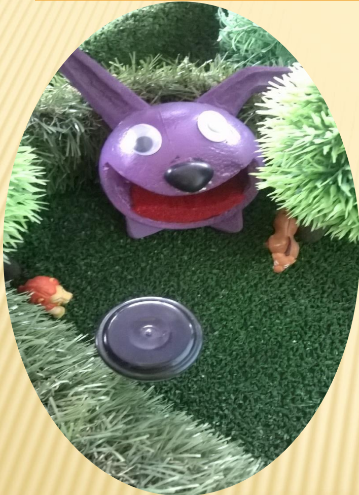
Мягкая скамейка «Зверёк»