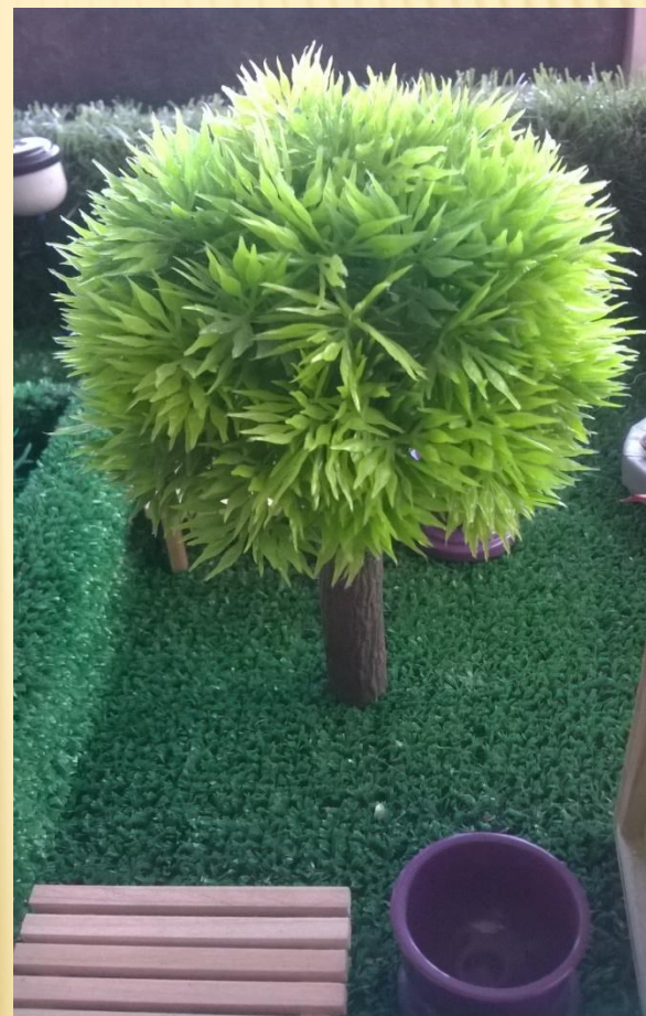
Ива лоховая узколистная