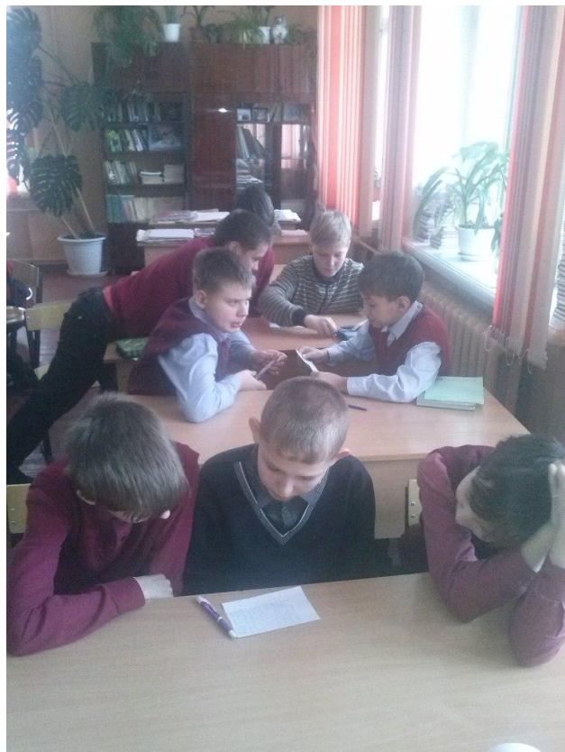
РАБОТА В ГРУППАХ МБОУ СОШ №11