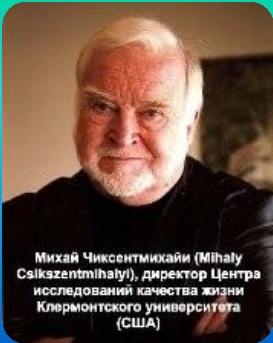
Михай Чиксентмихайи (Mihaly Csikszentmihalyi), директор Центра исследований качества жизни Клермонтского университета (США)

Михай Чиксентмихайи - человек, одержимый счастьем.