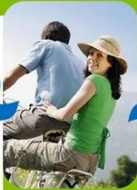
Активный образ жизни