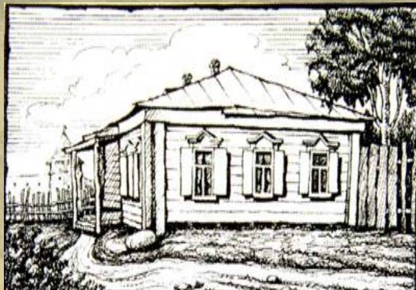
Дом в Зарайске, где родился В.В. Виноградов.