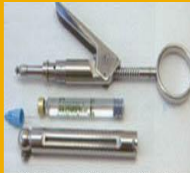
Карпульный баянетный шприц