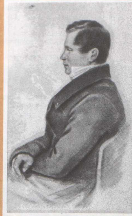
И. И. Пущин Литография с оригинала Д. М. Соболевского. 1825 г.

... Поэта дом опальный, О Пущин мой, ты первый посетил; Ты усладил изгнанья день печальный, Ты в день его Лицея превратил.