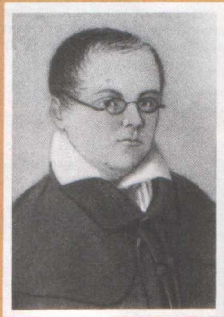
А. А. ДЕЛЬВИГ

Когда постиг меня судьбины гнев, Для всех чужой, как сирота бездомный, Под бурею главой поник я томной И ждал тебя, вещун пермесских дев, И ты пришел, сын лени вдохновенный, О Дельви́г мой: твой голос пробудил Сердечный жар, так долго усыпленный, И бодро я судьбу благославил.