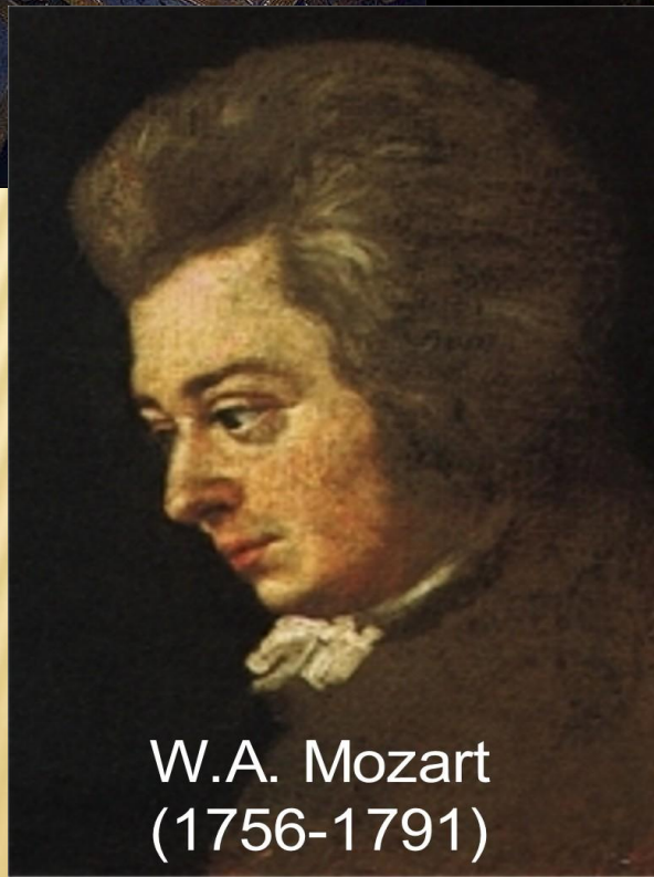
W.A. Mozart (1756-1791)

МОЦАРТ В ЧЕТЫРЕ ГОДА, ИГРАЛ НА ОРГАНЕ, СКРИПКЕ, В ПЯТЬ ЛЕТ, СОЗДАВАЛ ПЕРВЫЕ СОЧИНЕНИЯ.