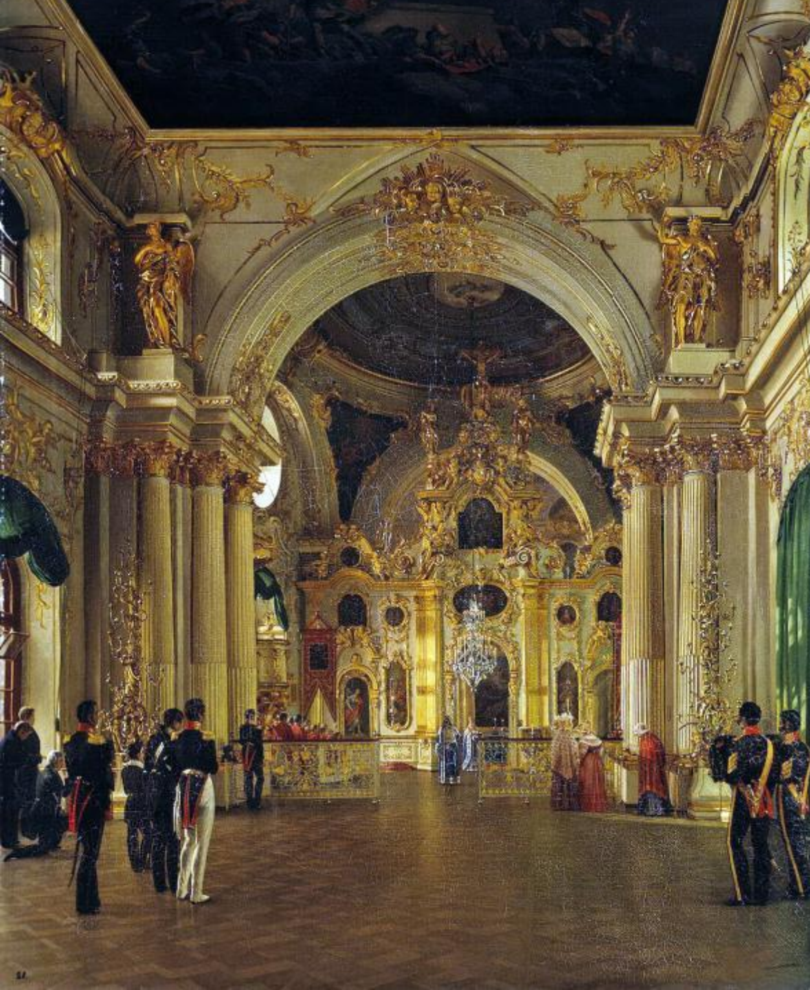
Внутренний вид Большой церкви Зимнего дворца.