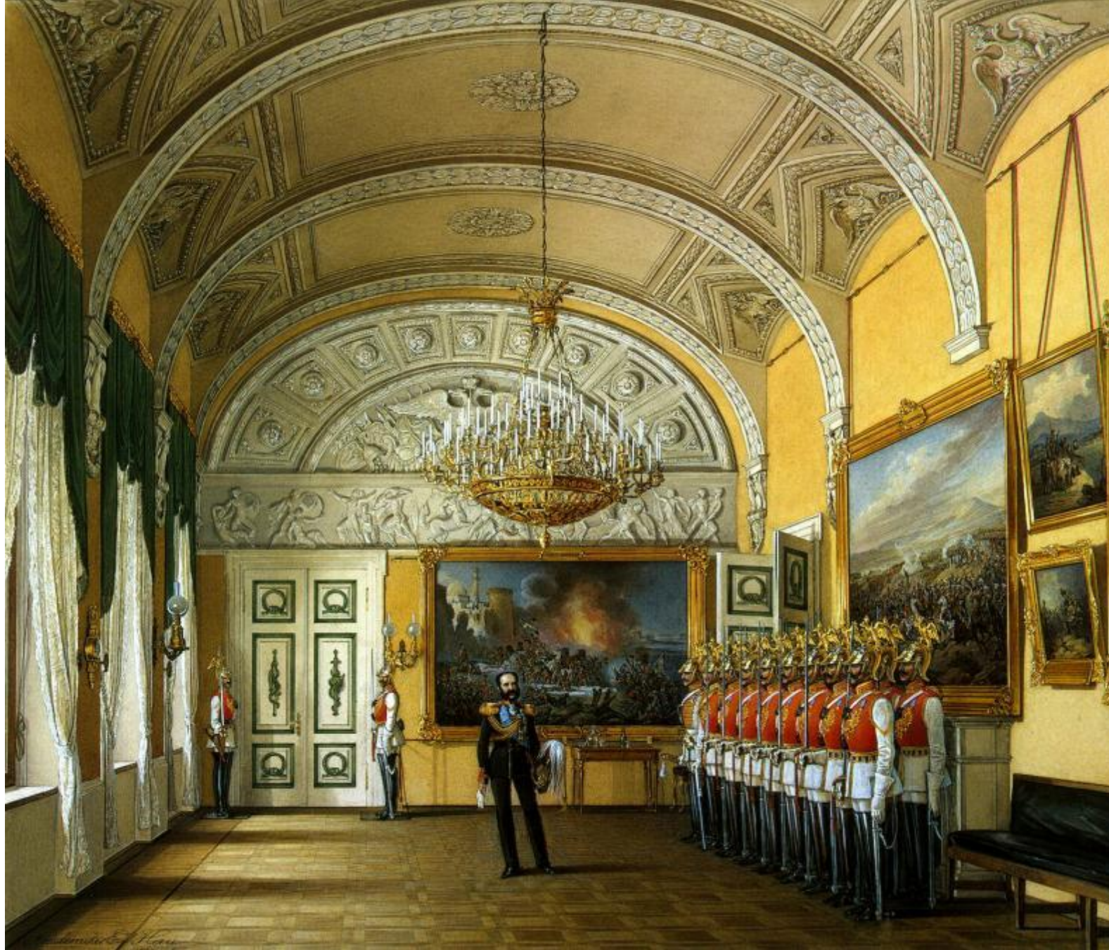
Виды залов Зимнего дворца. Зал развода караула