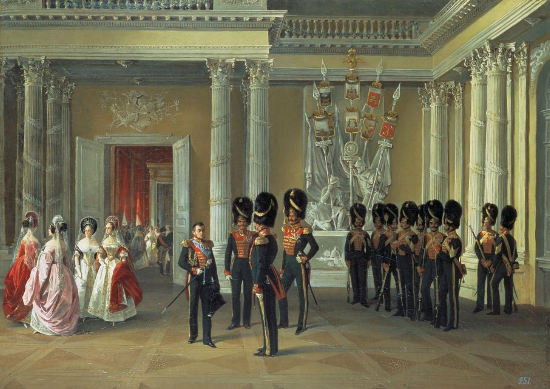
Гербовый зал Зимнего Дворца.