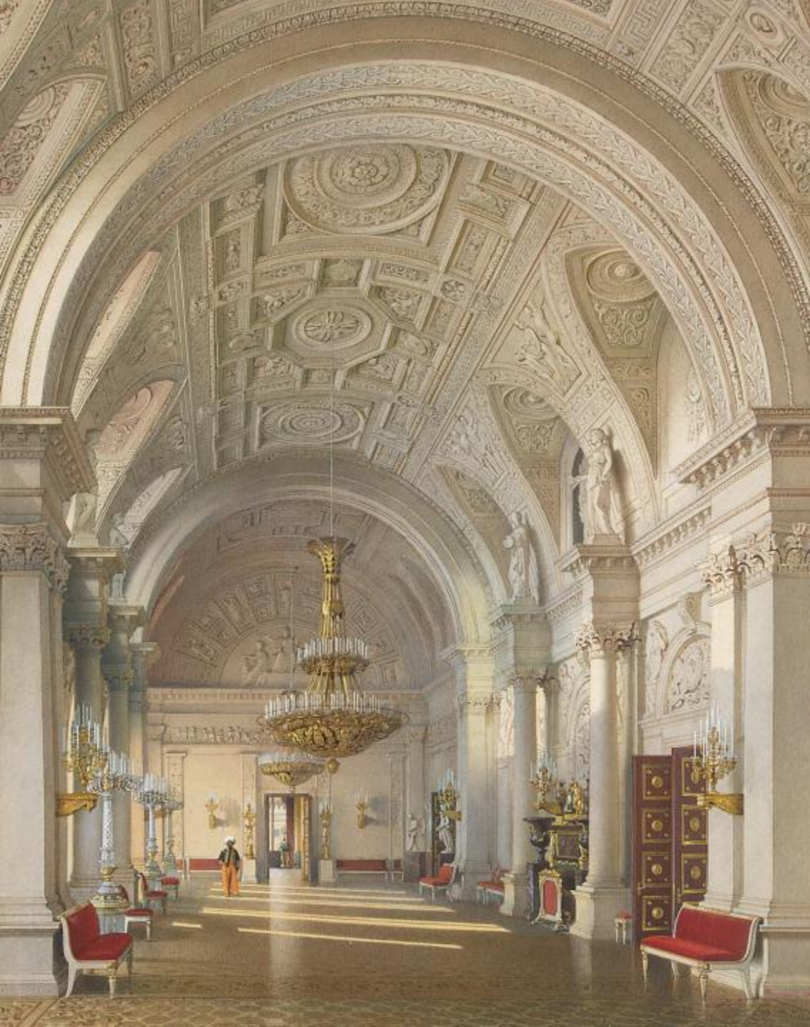
Белый зал Зимнего дворца.