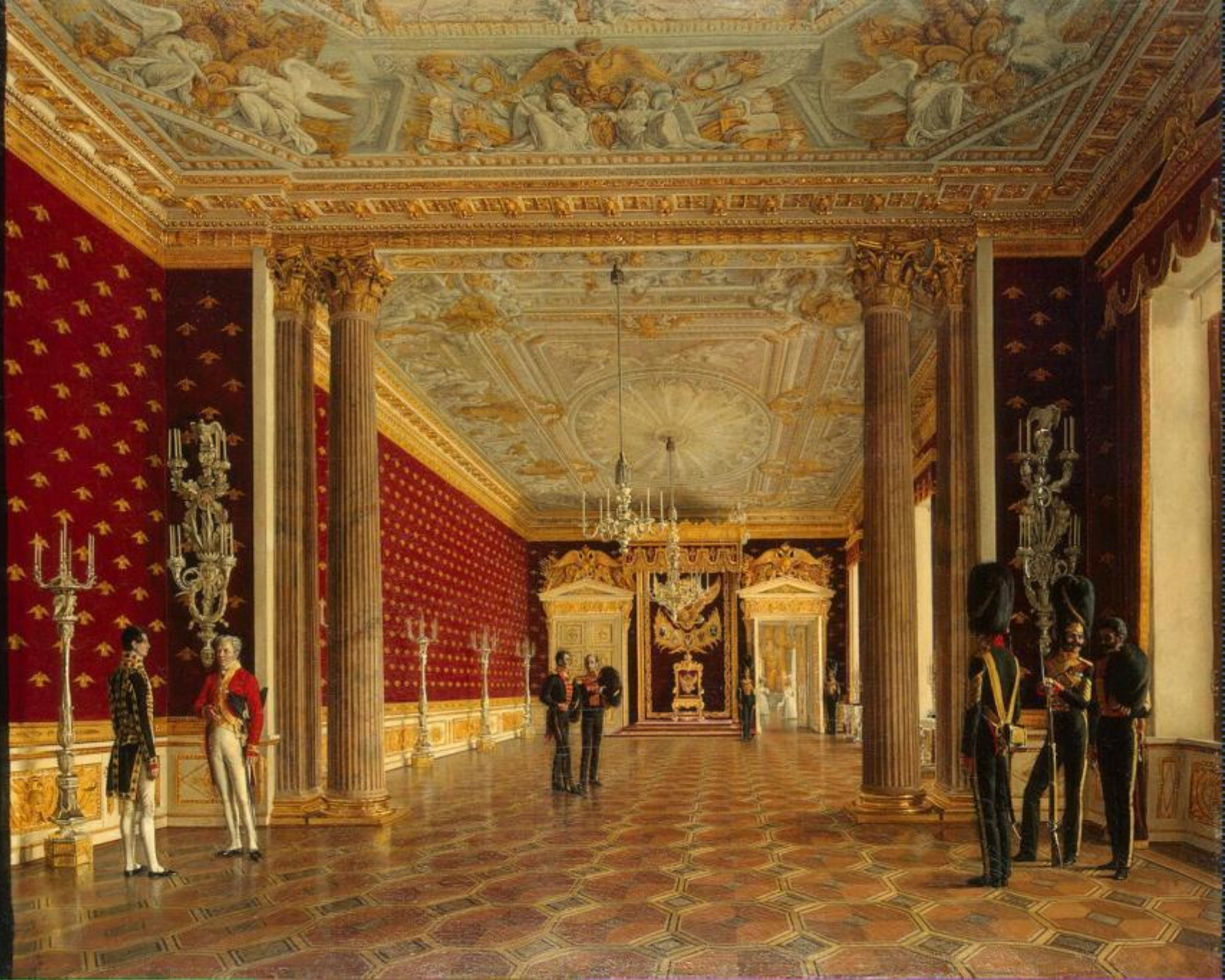
Тронный зал императрицы Марии Федоровны в Зимнем дворце.