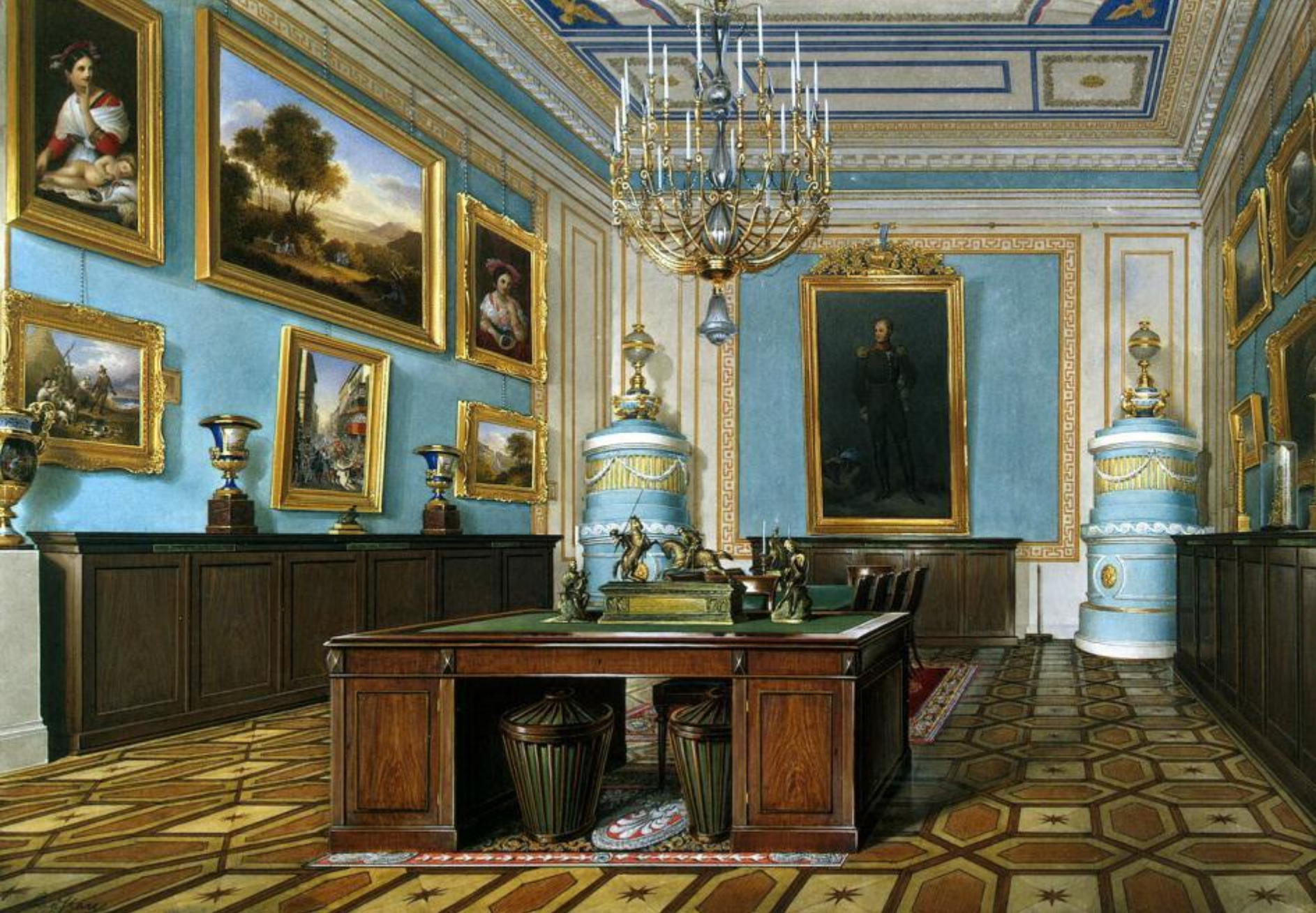
Зал Совета императора Александра I