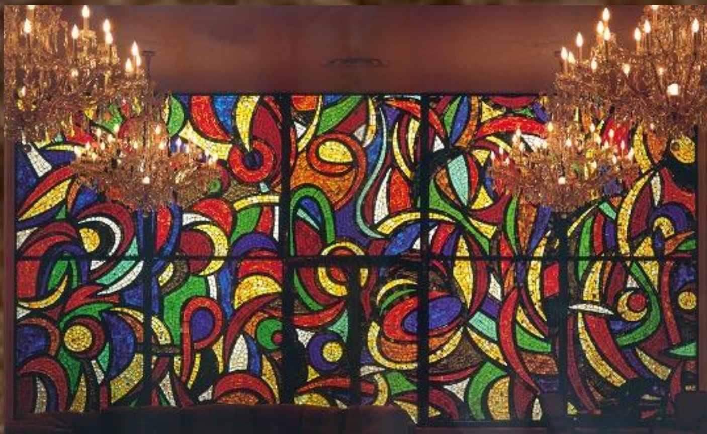
Зураб Церетели Витраж «Салют»