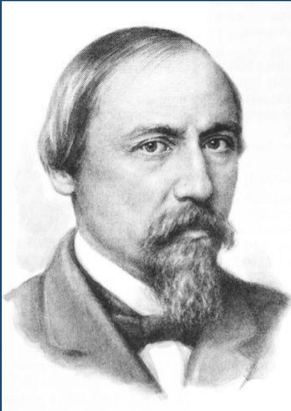
Николай Алексееви ч Некрасов