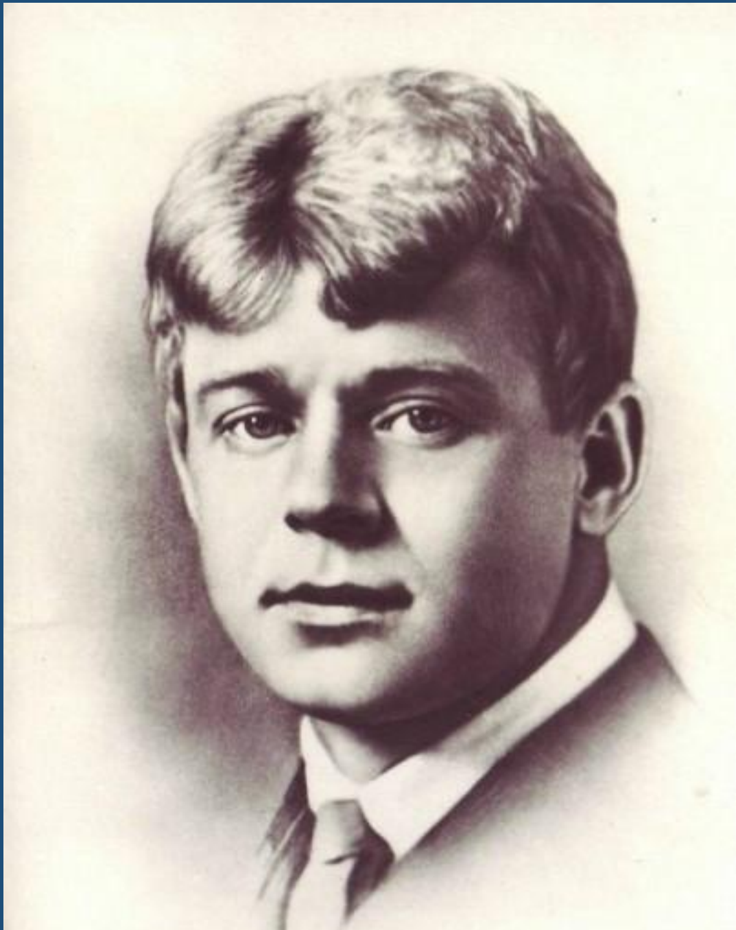
Сергей Александрович Есенин