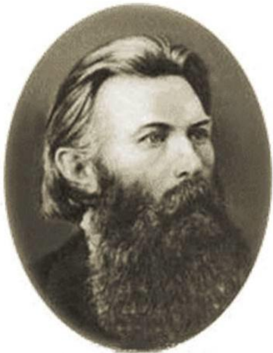
Иван Захарович Суриков