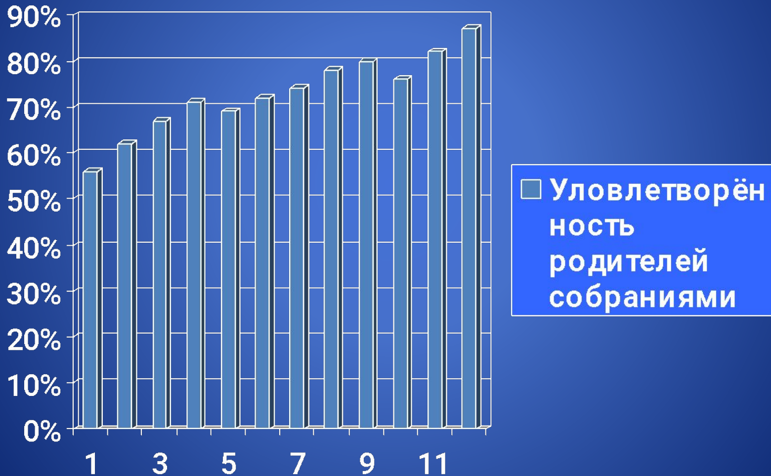
График удовлетворённости родителей проводимыми родительскими собраниями.