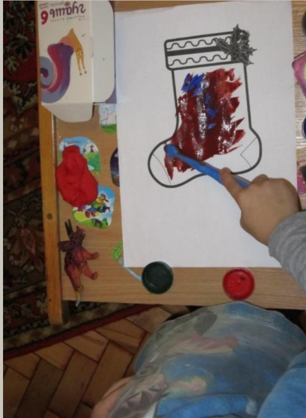
«Носочек для Деда Мороза»