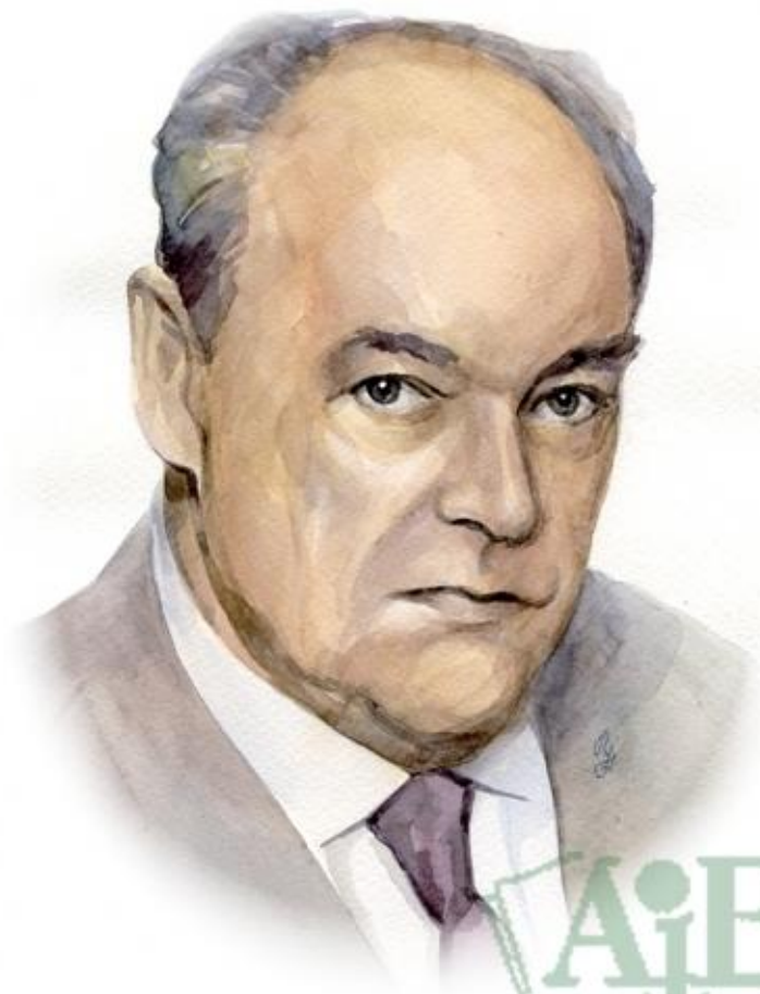
Чарушин Евгений Иванович (1901–1965)

Чарушин Евгений Иванович - русский художник и писатель.