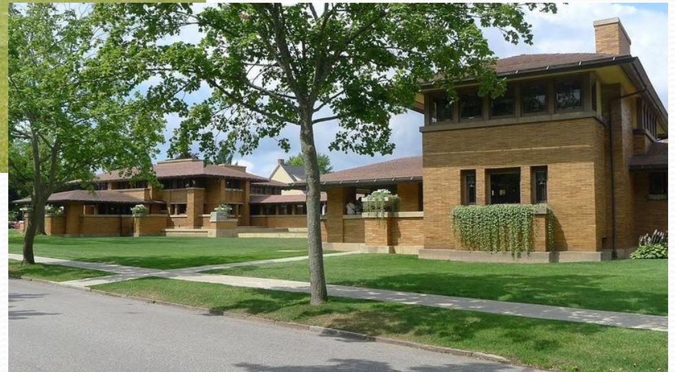
Дом Мартина (1903-1905)