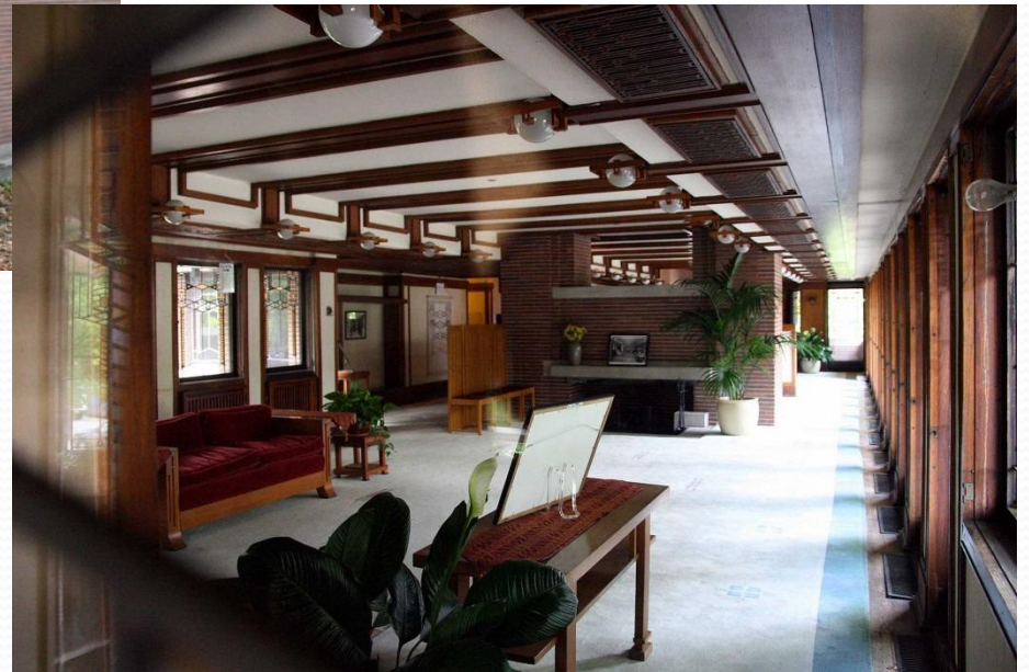
Дом Роби (1909)