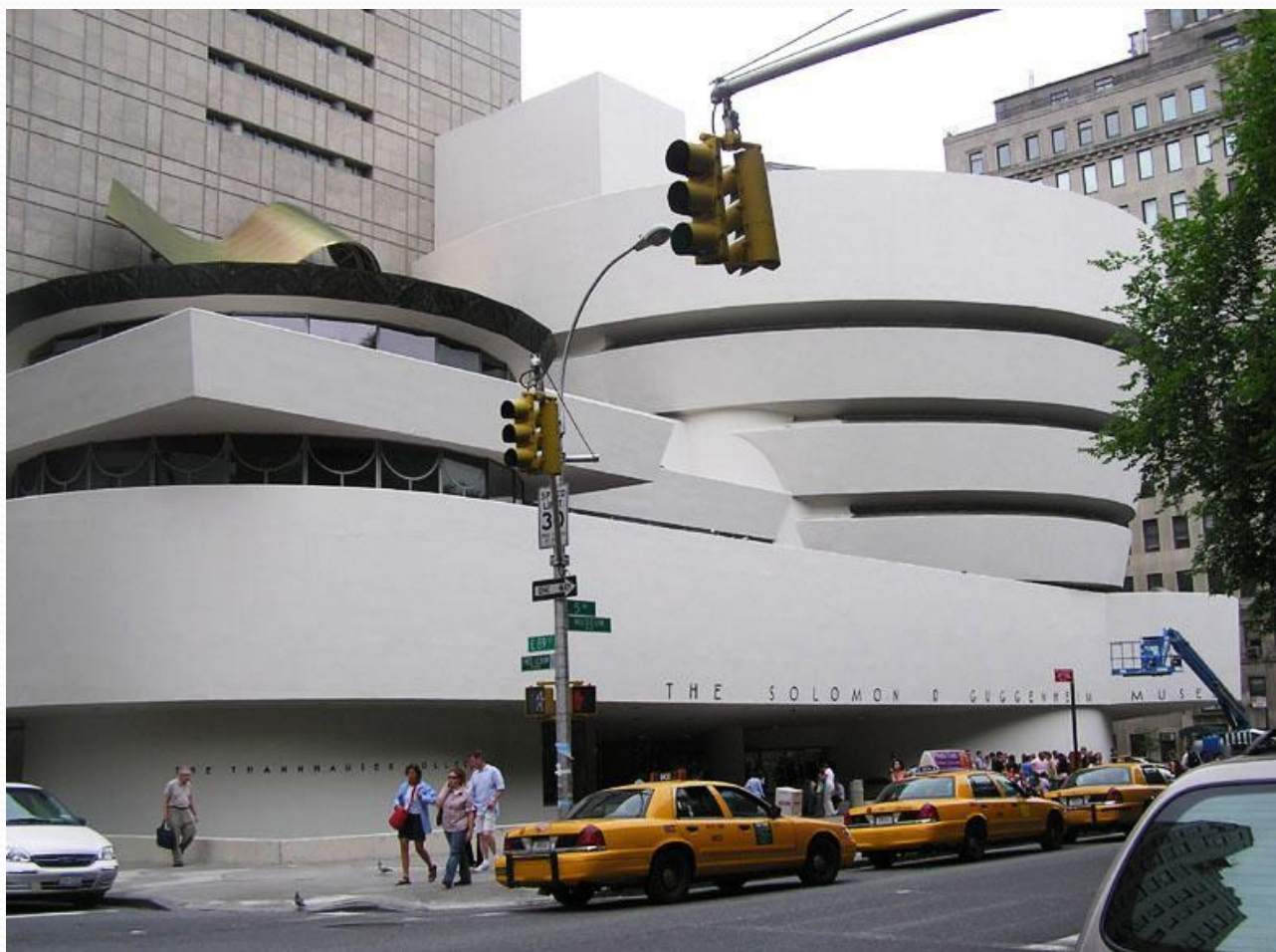
Музей Соломона Гуггенхейма в Нью-Йорке (1943—1959)