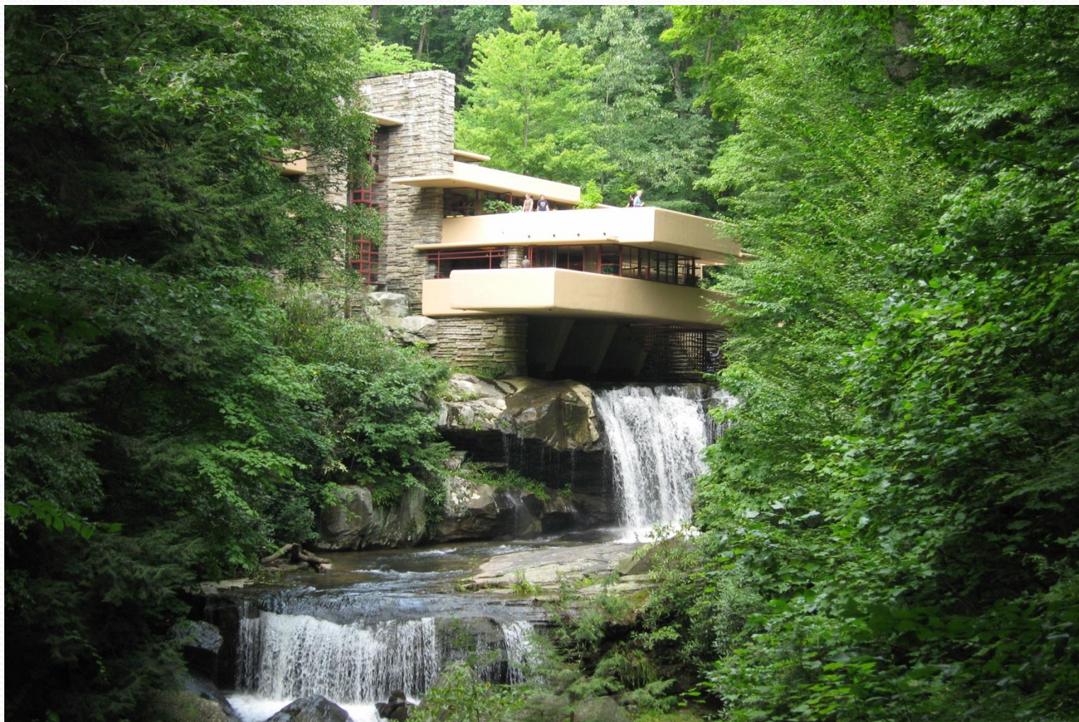
«Дом над водопадом» (1935)