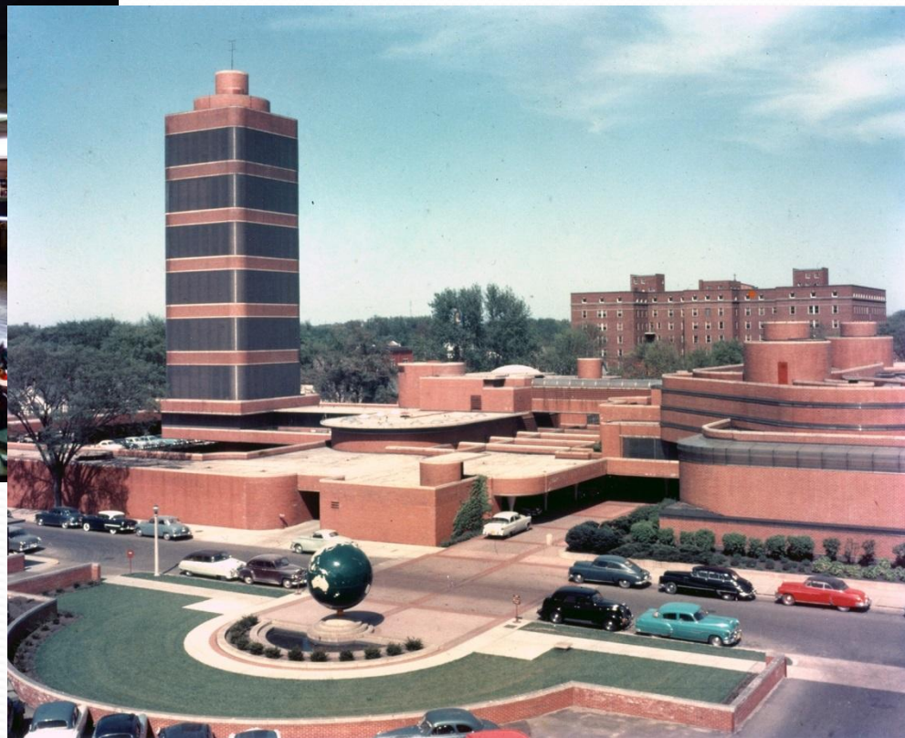
Штаб-квартира «Джонсон Вакс» (1936—1939)