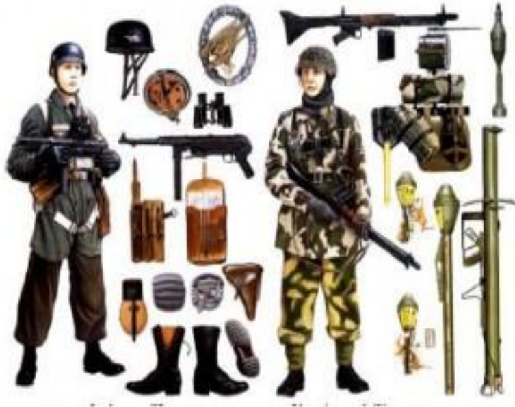
145. Ефрейтор, бригада «Герман Геринг»