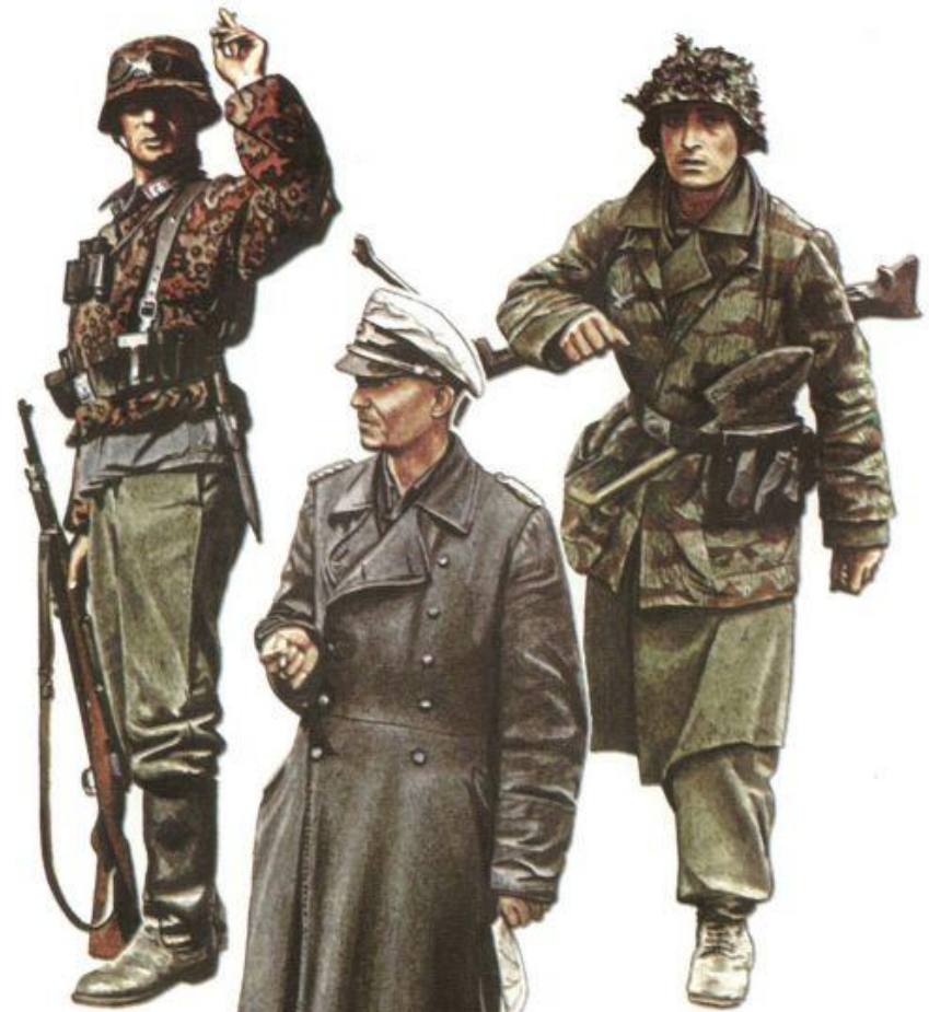
147. Гренадер авиаполевой дивизии