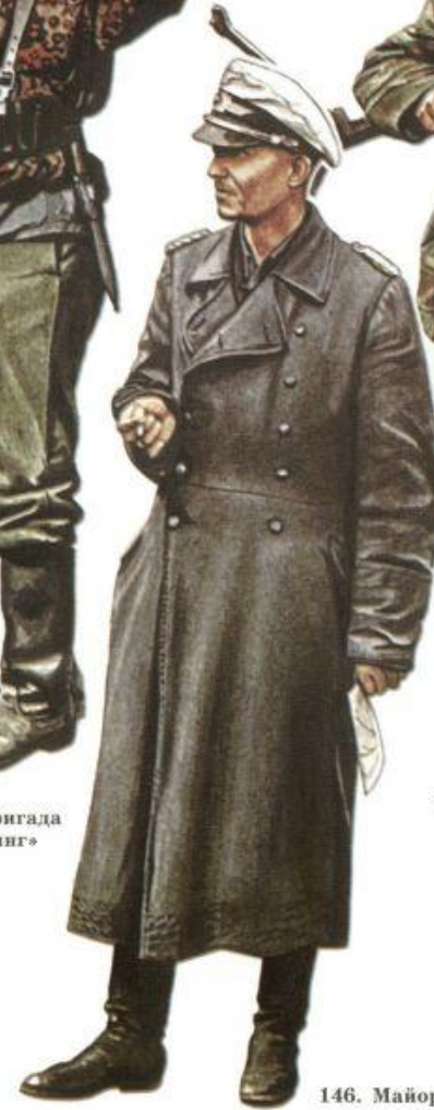
146. Майор парашютно-десантного полка