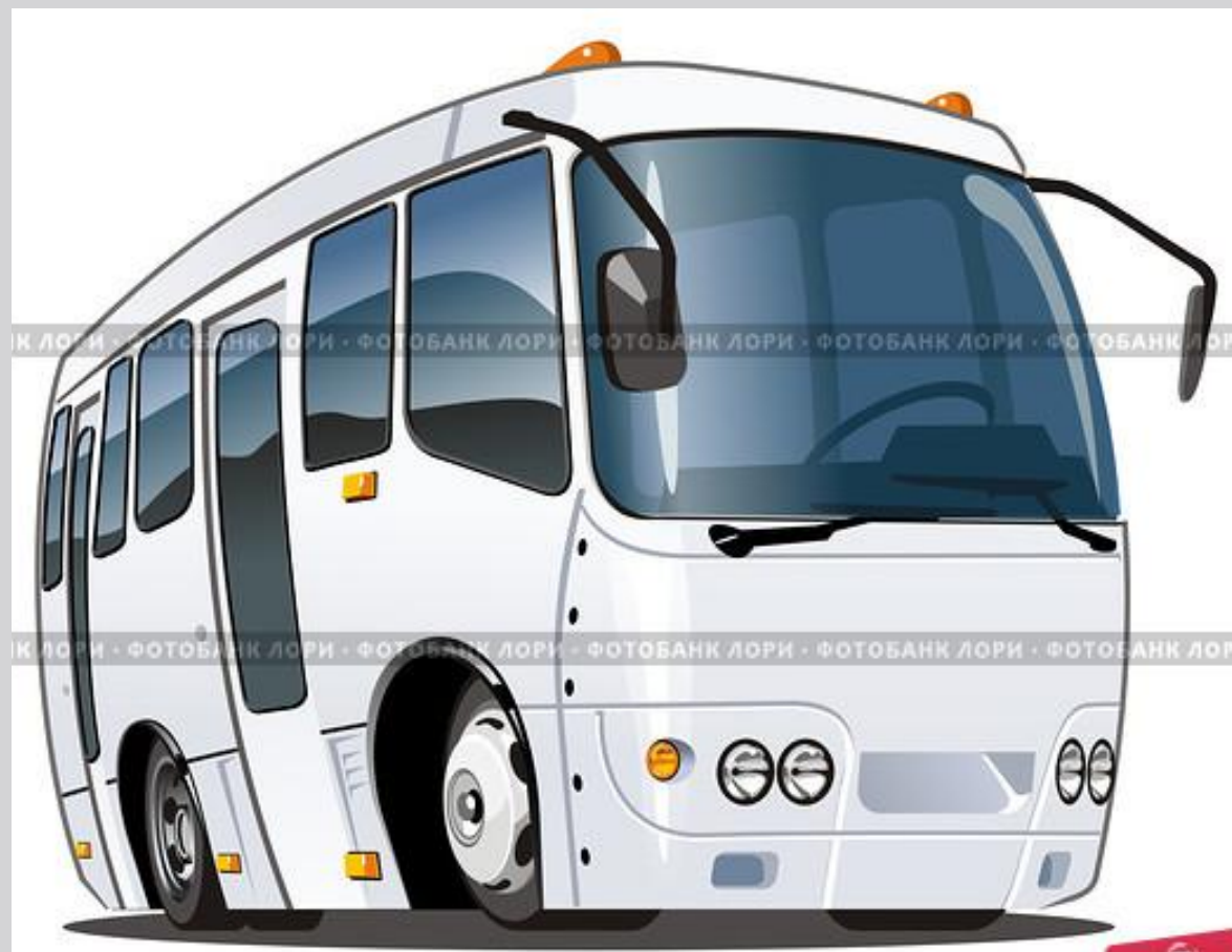
Мультяшный автобус

Что за чудо светлый дом? Пассажиров много в нем. Носит обувь из резины И питается бензином.