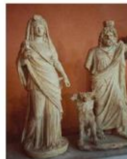
Аид – Бог Подземного царства