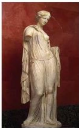
Афродита – Богиня Любви