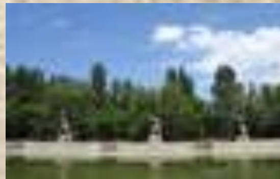
Скульптуры на площади «Героев»

«Вечная слава героям, павшим в боях за свободу и независимость нашей Родины!»