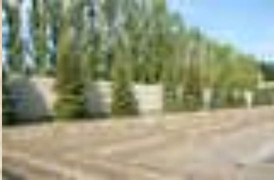
Стена – знамя.