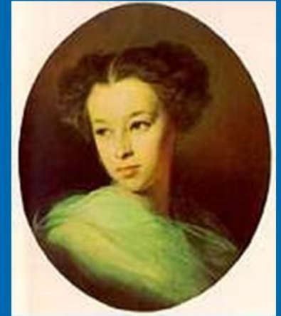
Младшая дочь, Наталья Александр овна Пушкина (1836-1913г.) Получила