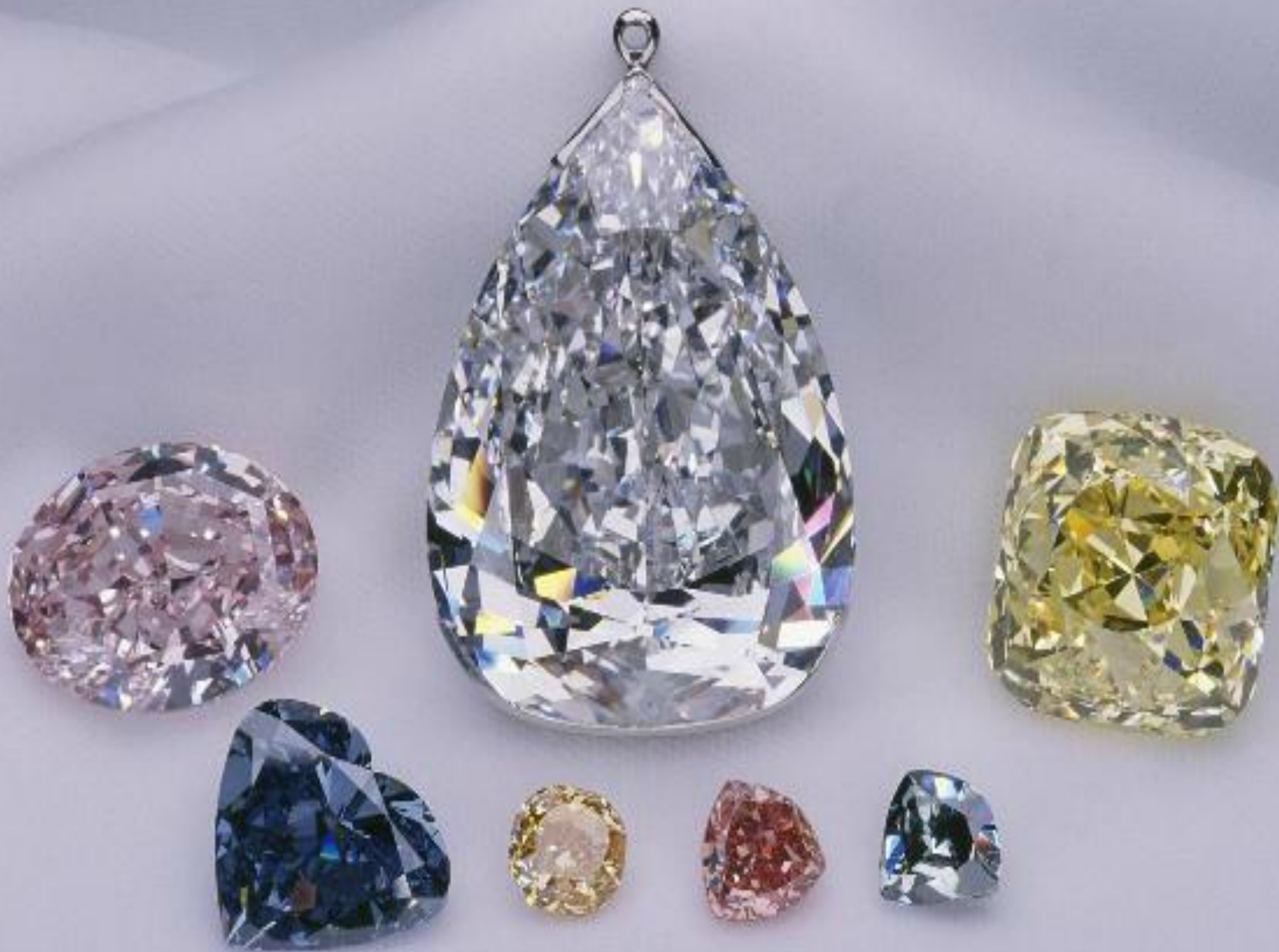
Алмаз «Звезда Тысячелетия»