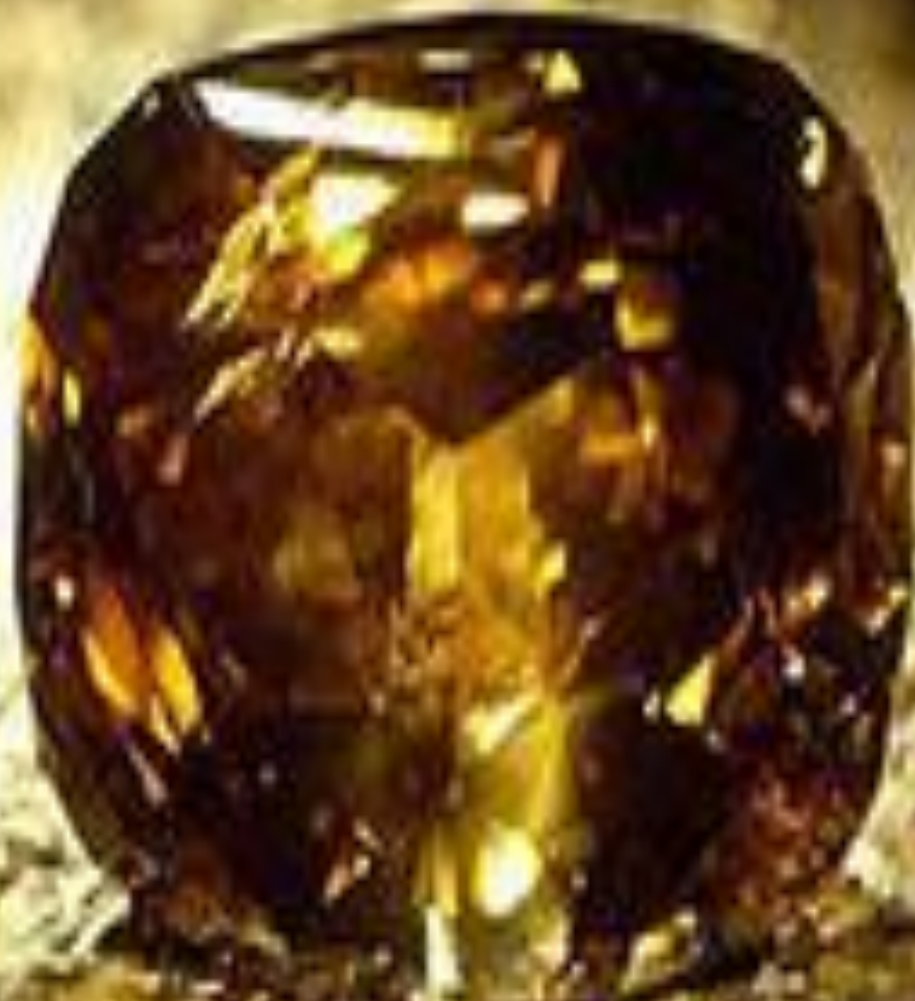
Алмаз «Золотой юбилей»