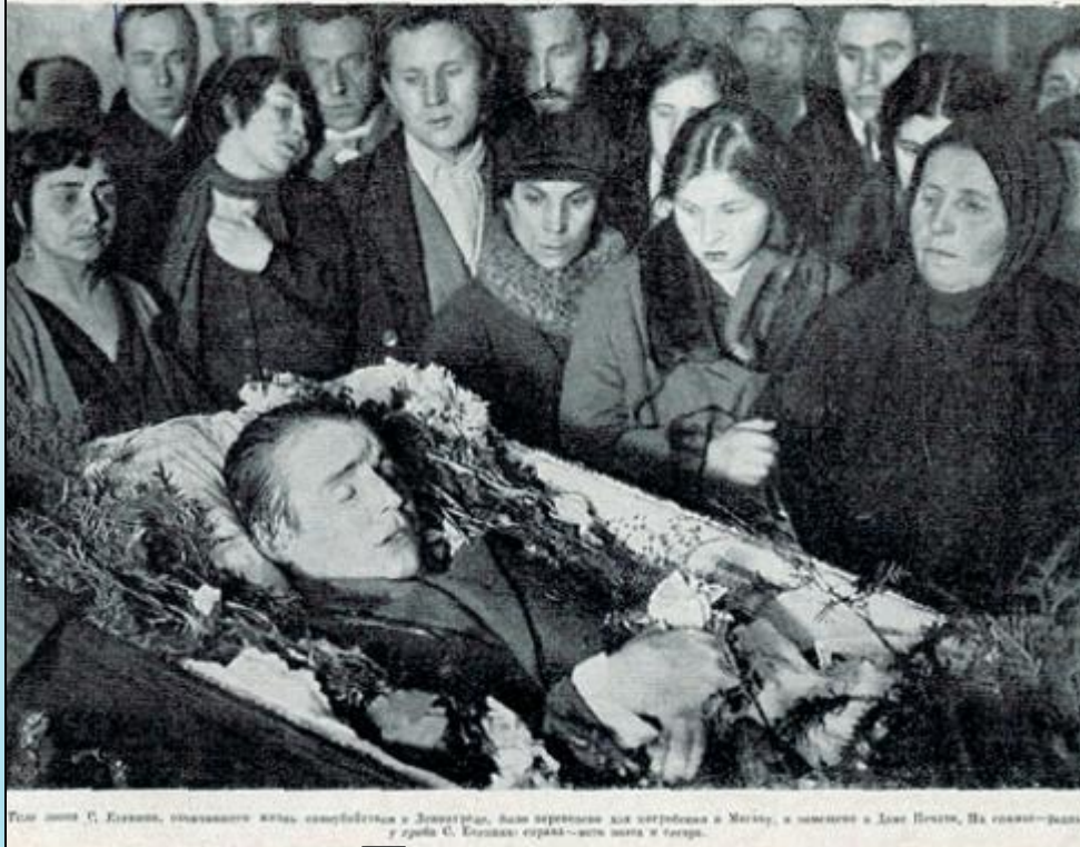
Тело поэта С. Есенина, спавшего жаль, завернутое в Ленинград, было перевезено для погребения в Москву, и похоронено в Давосе. На снимке — родственники и друзья С. Есенина: справа — мать поэта и сестра.

28 декабря 1925 года Есенина нашли в ленинградской гостинице « Англетер » повешенным на трубе парового отопления . Последнее его стихотворение — «До свиданья, друг мой, до свиданья...» — было написано в этой гостинице кровью, и по свидетельству друзей поэта, Есенин жаловался, что в номере нет чернил, и он вынужден был писать кровью.