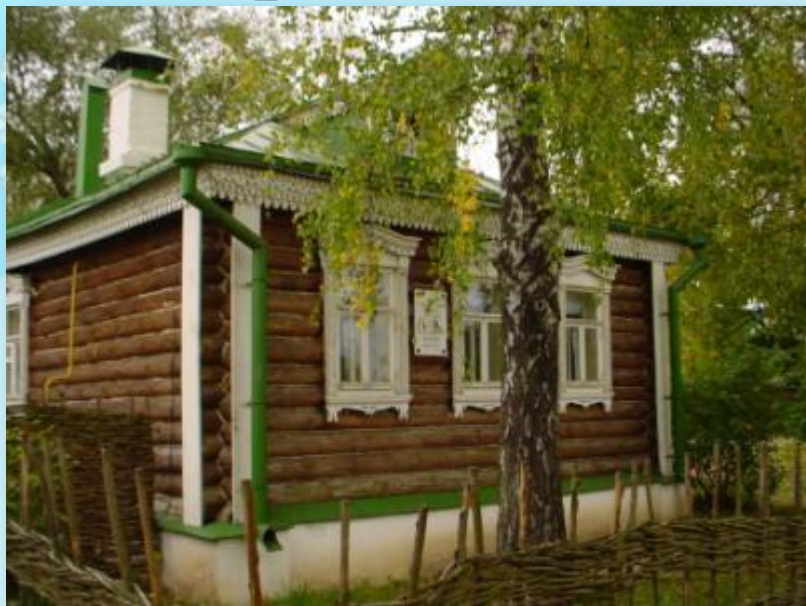
Дом Сергея Есенина