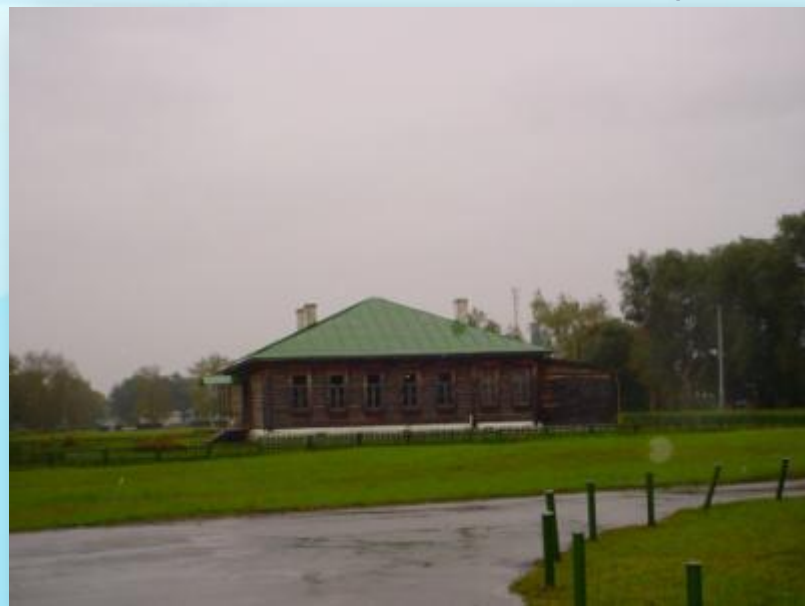
Начальная земская школа