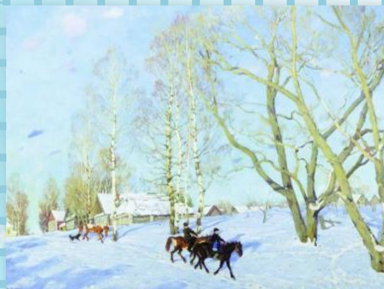
К.Ф.Юон. Мартовское утро