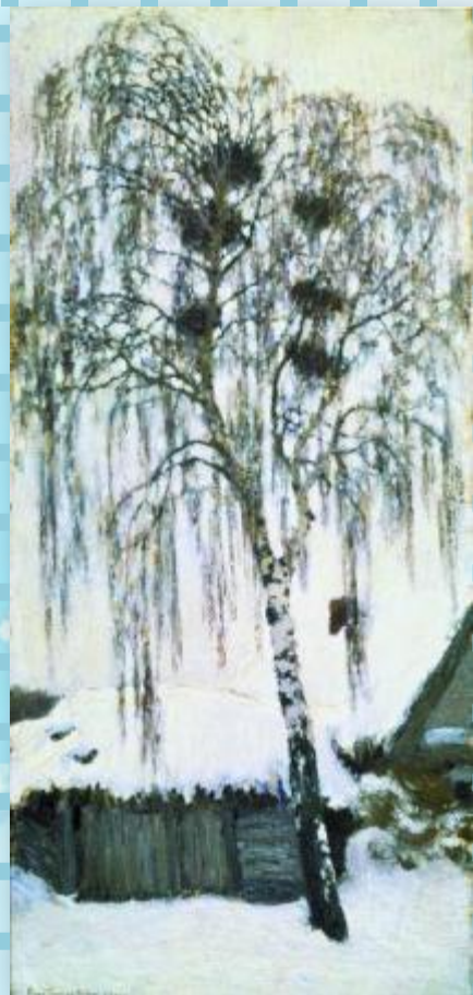
И.Грабарь Белая зима. Грачиные гнёзда