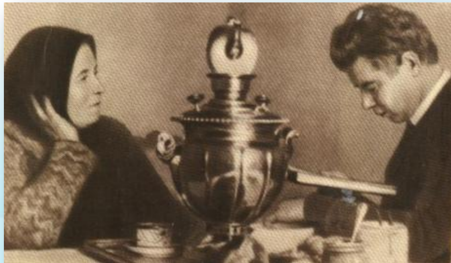
Есенин с матерью