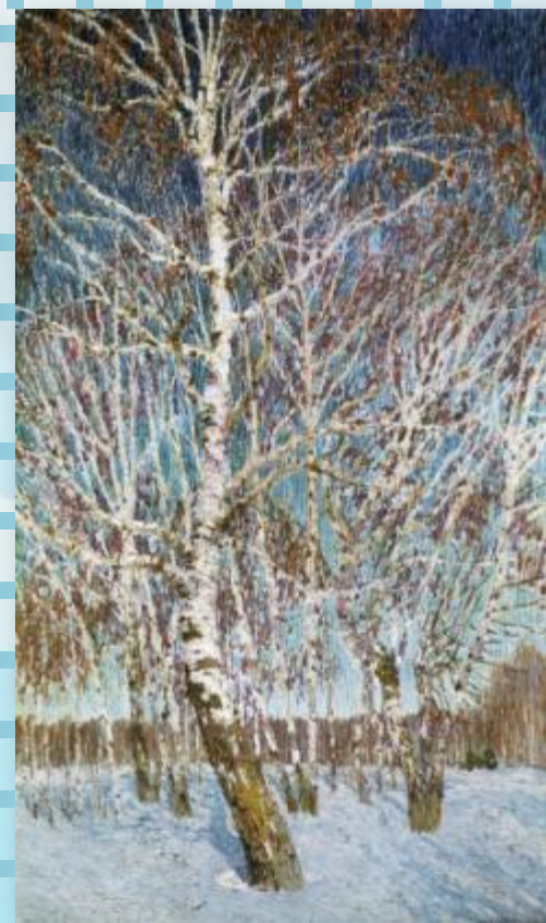
И.Грабарь Февральская лазурь