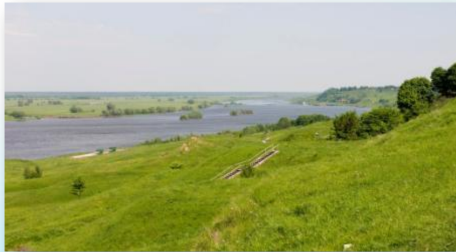
Вид на Оку