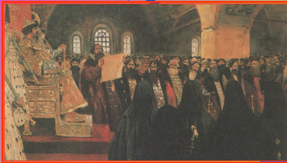
С.В. Иванов «Земский собор»