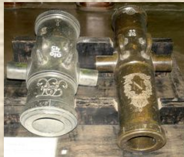
Русские трофеи Слева бронзовый ствол 6-дюймовой гаубицы