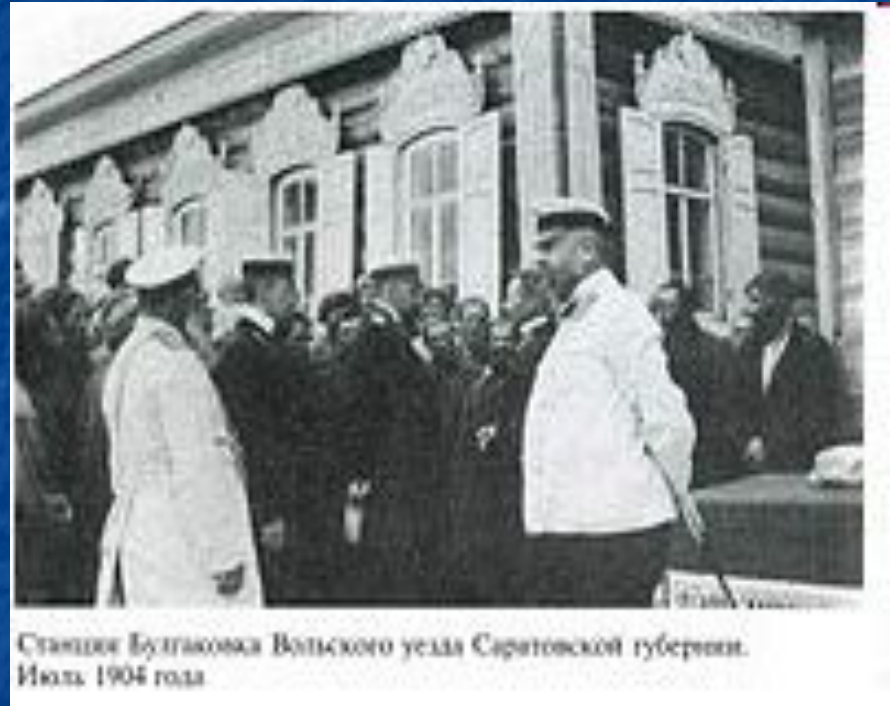
Станция Бутгакомья Волынского уезда Саратовской губернии. Июль 1904 года