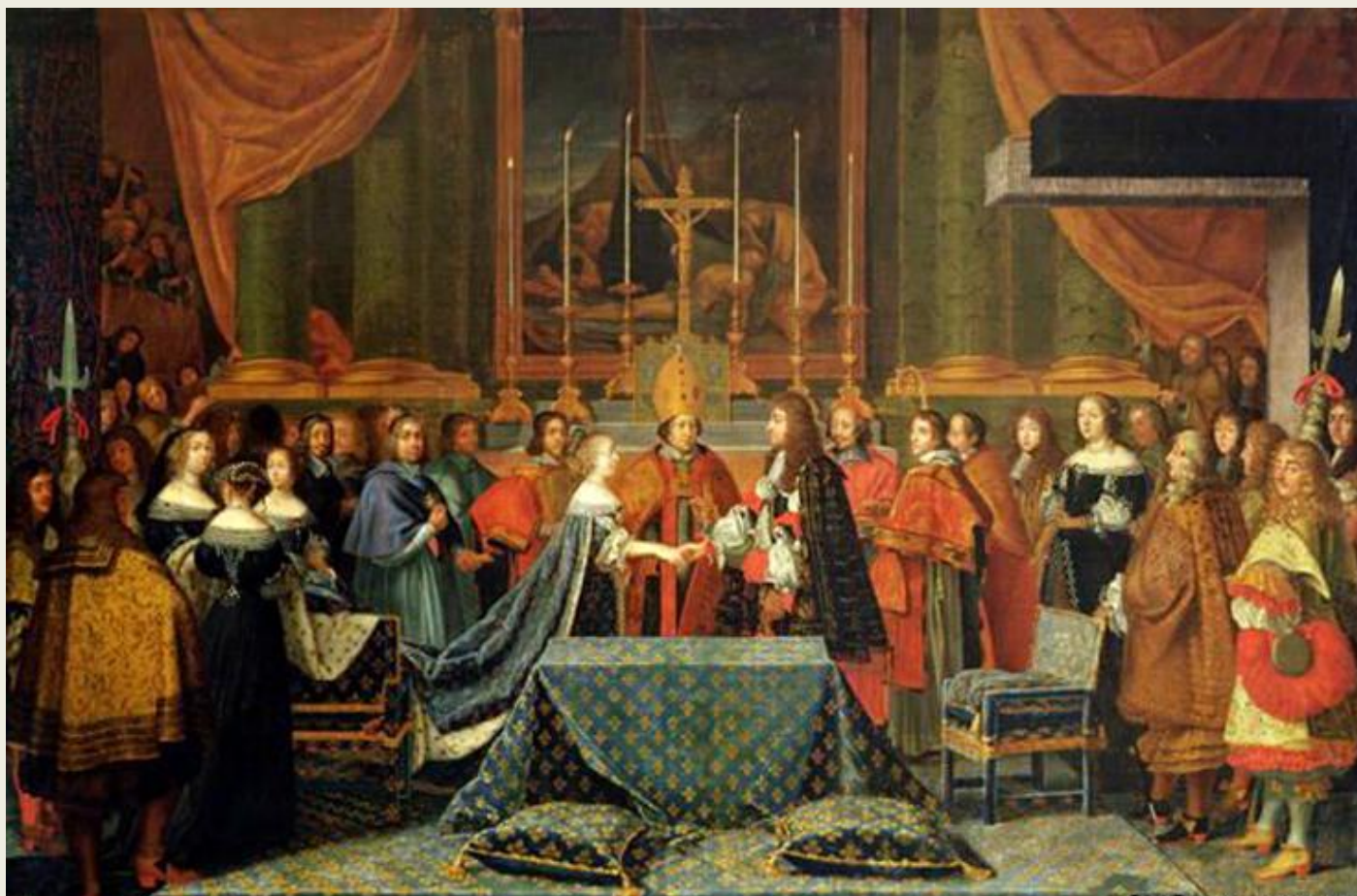
Свадьба Людовика XIV и Марии - Терезии.