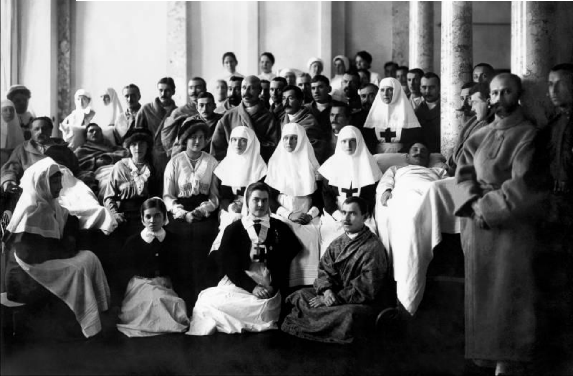
Медицинский персонал и раненые в Царскосельском дворцовом лазарете. Царское Село. 1915.