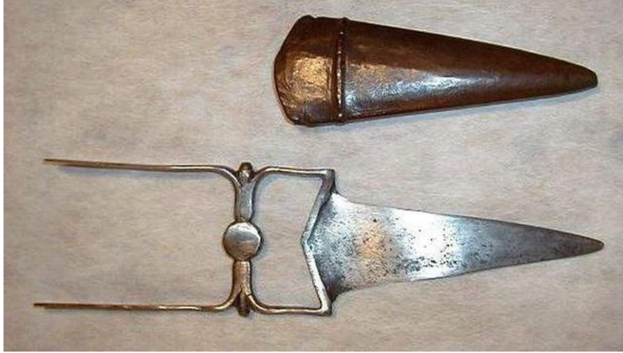
Катар (зброя): Індійський кинджал катар

Оздоблені нефритом, слоновою кісткою та розкішним декором із золота руків'я шабель. Індійська техніка карбування не має аналогів у інших країнах. У зброї виявлено найкращі зразки ковальства та ювелірного мистецтва.