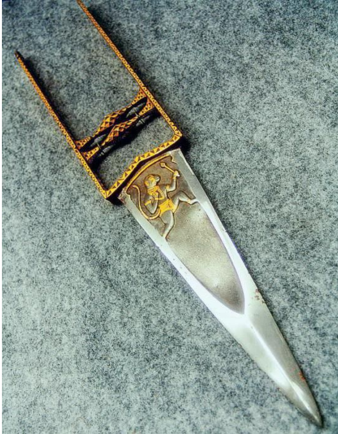
Індійський кинджал катар