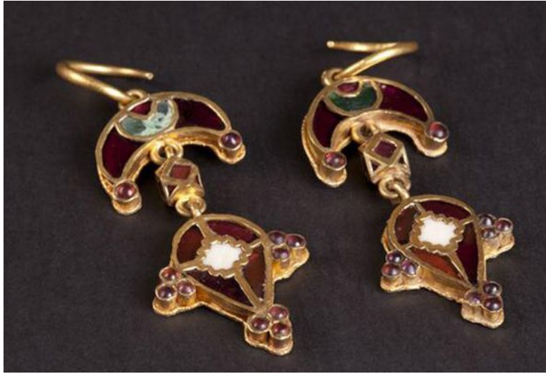
Золоті сережки в формі лунниці з гранатом із Індії, знайдені в могильнику Джург-оба.