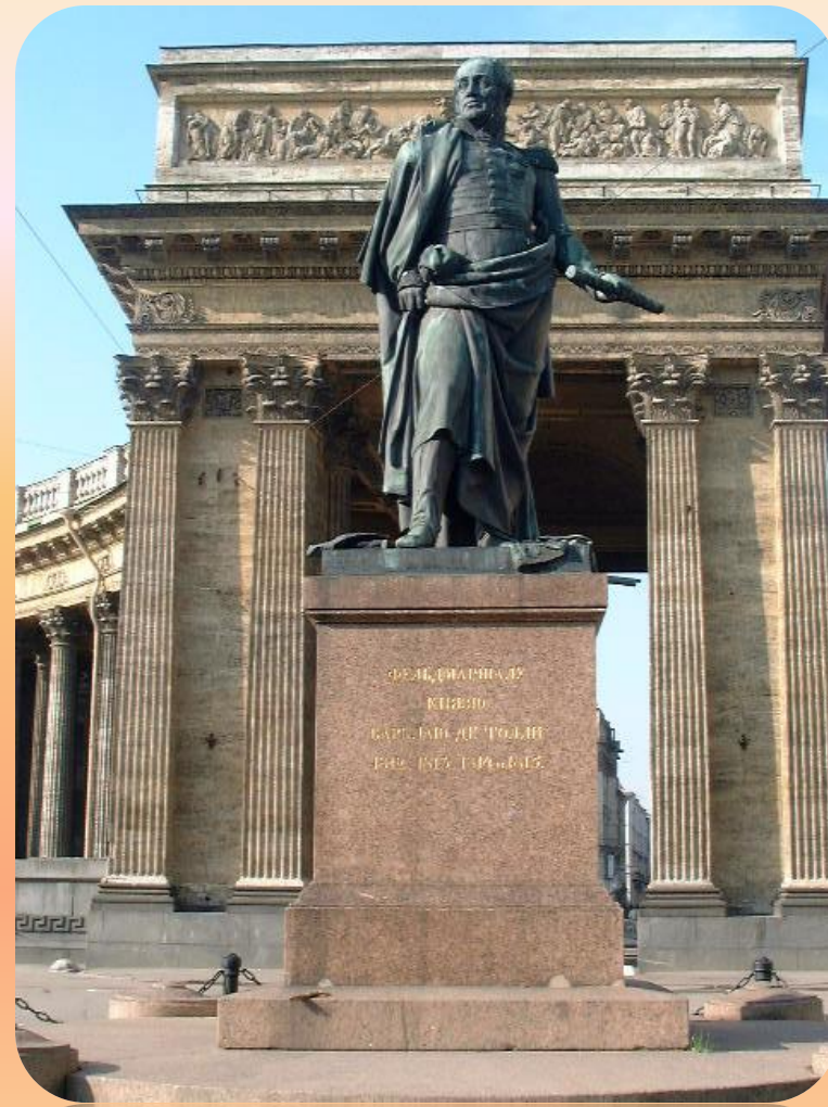
Памятник М.Б. БАРКЛАЮ-ДЕ-ТОЛЛИ