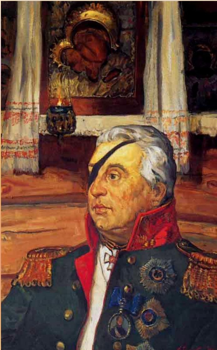
Михаил Илларионович КУТУЗОВ