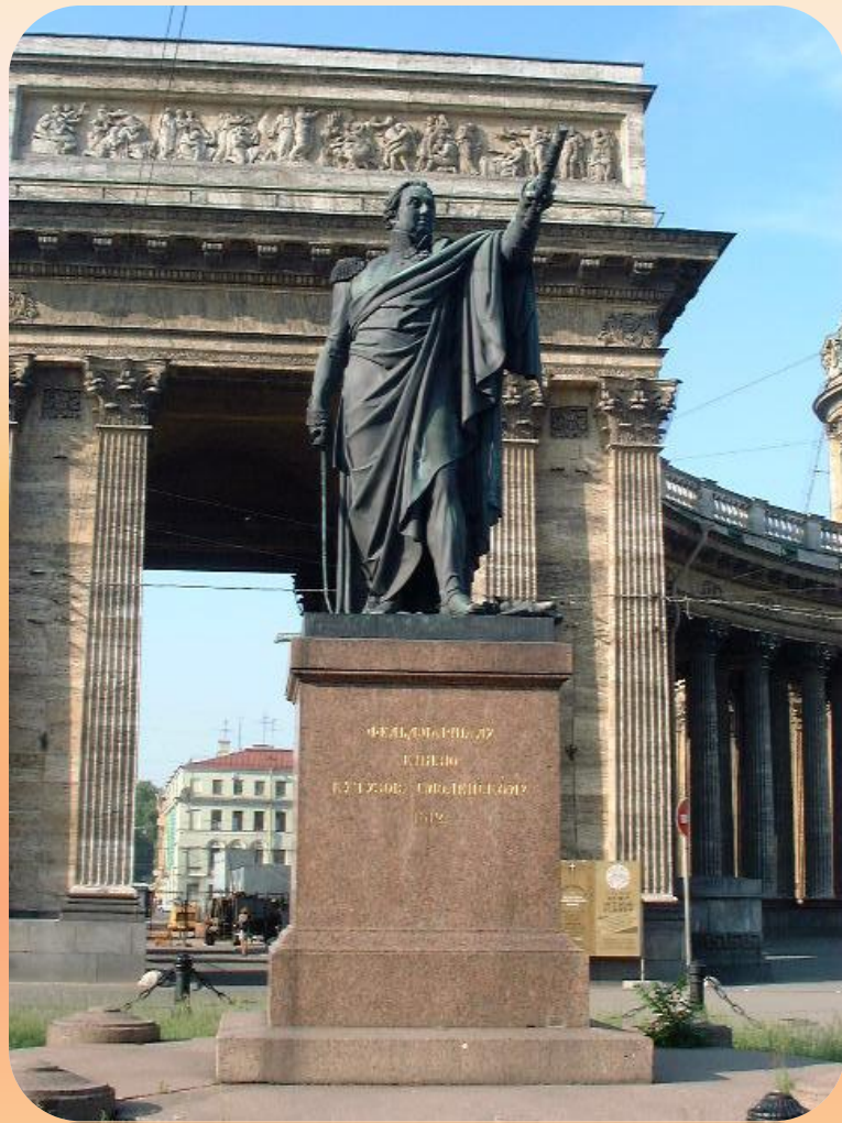
Памятник М.И. КУТУЗОВУ