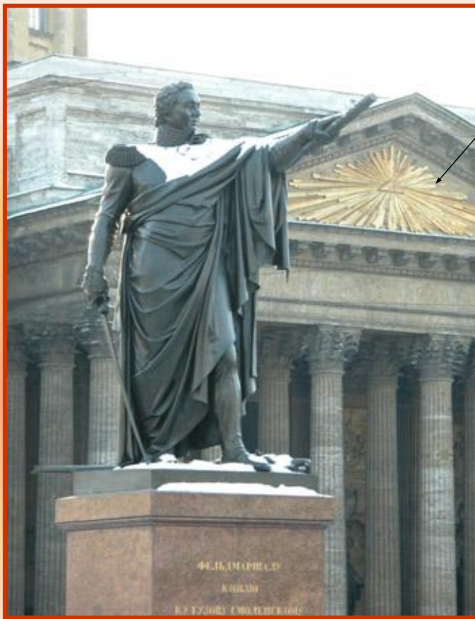
Рельеф «ВСЕВИДЯЩЕЕ ОКО»