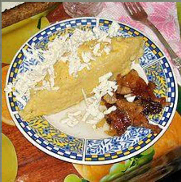
Мамалыга с брынзой и шкварками

Молда́вская кúхня — национальная кухня Молдавии. Молдавия расположена в регионе богатых природных возможностей, винограда, фруктов и разнообразных овощей, а также овцеводства и птицеводства, что обуславливает богатство и разнообразие национальной кухни.