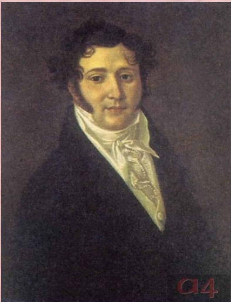
Юрий Петрович Лермонтов, отец поэта. Неизвестный художник. 1810-е

По мужской линии род Лермонтовых (отец поэта — Юрий Петрович Лермонтов, капитан в отставке из небогатых помещиков Тульской губ.) ведет свое начало от Георга Лермонта (Шотландия). Находясь на службе у польского короля, в 1613 г. Лермонт перешел на сторону русских, сражался в чине офицера в отряде Д. Пожарского и в 1621 г. за хорошую службу царю получил грамоту на владение землей в Галическом у. Костромской губ. От него и пошли Лермонтовы, уже во втором колене принявшие Православие.