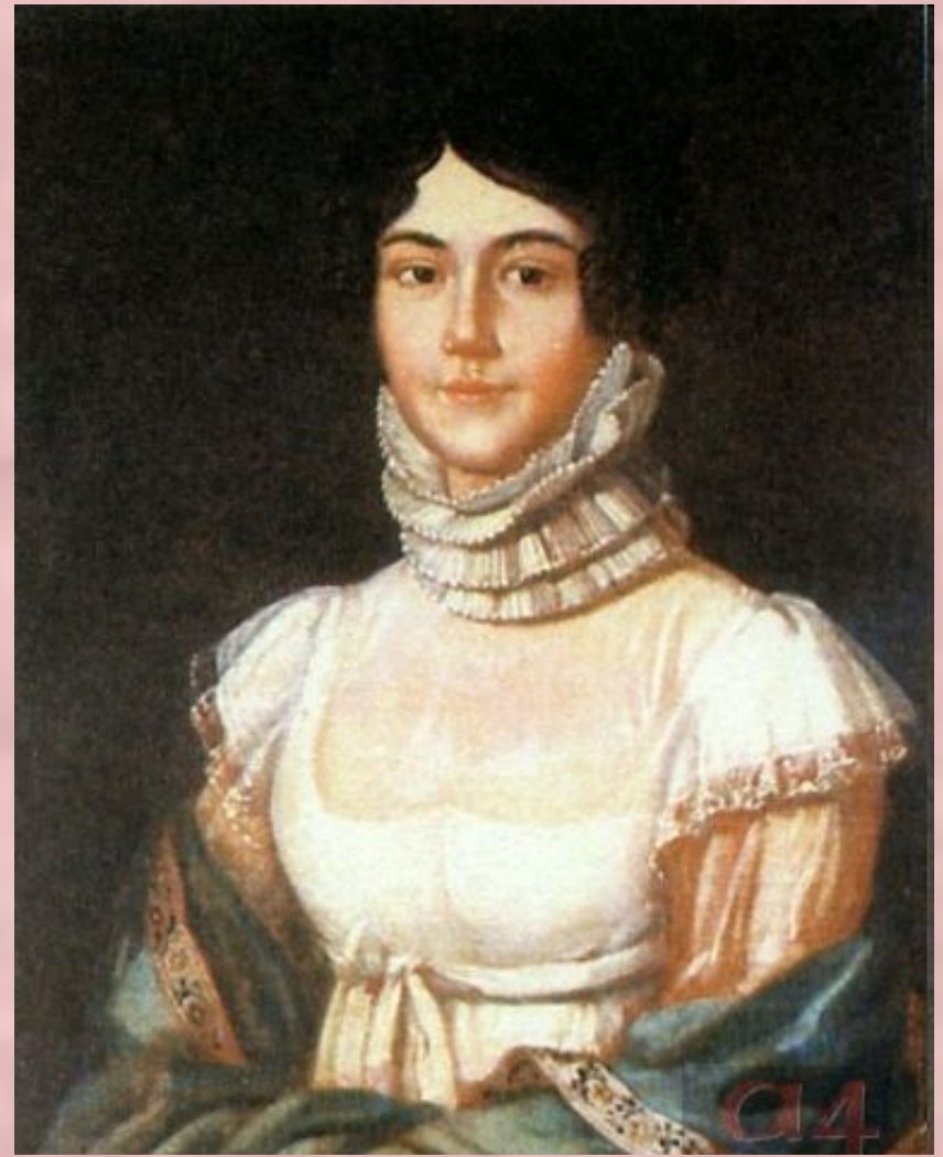
Мария Михайловна Лермонтова, мать поэта. Неизвестный художник. 1810-е

По материнской линии М. Лермонтов происходил из известного в России и богатого дворянского рода Столыпиных.