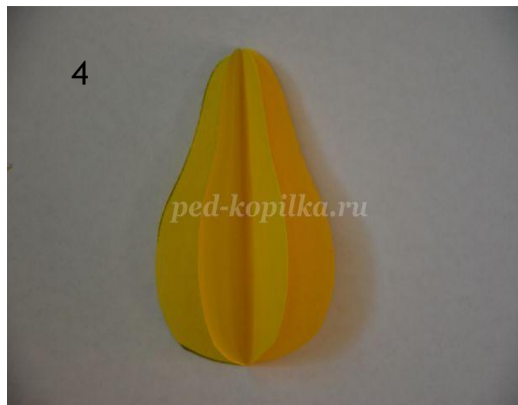
Склеиваем заготовки по линиям сгиба