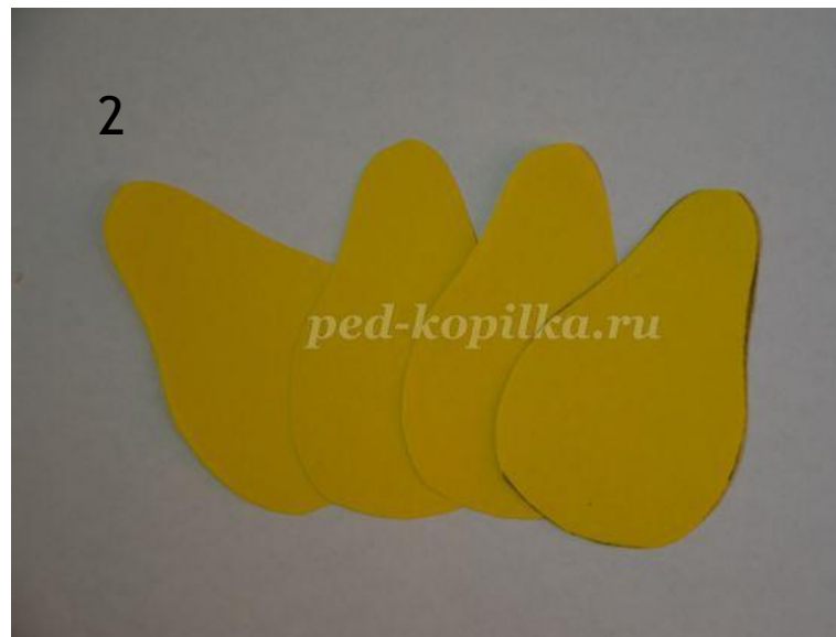
Вырезаем 4 заготовки