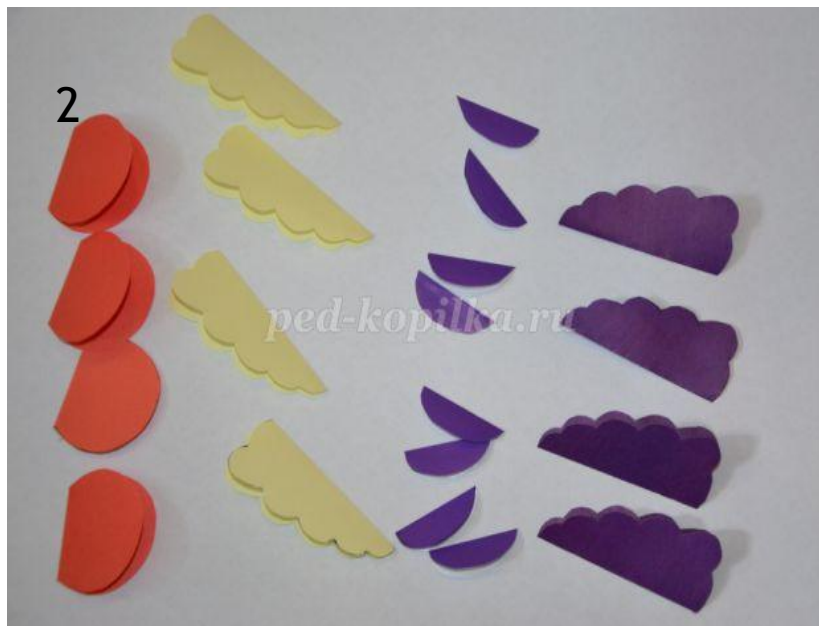
Складываем вырезанные заготовки пополам