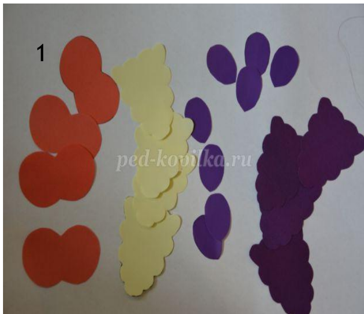
Вырезаем яблоко, виноград, сливу