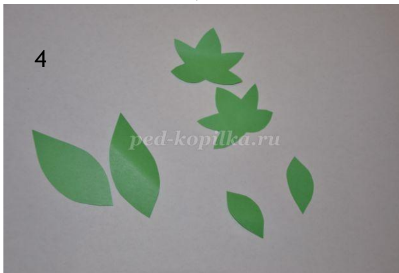
Вырезаем листочки и хвостики