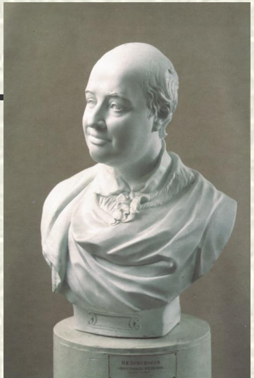
Скульптурный портрет М.В. Ломоносова (автор Ф.И.Шубин).

Бюст Ломоносова был создан в 1793 году для Камероновой галереи Царского Села, где размещались бюсты античных героев.