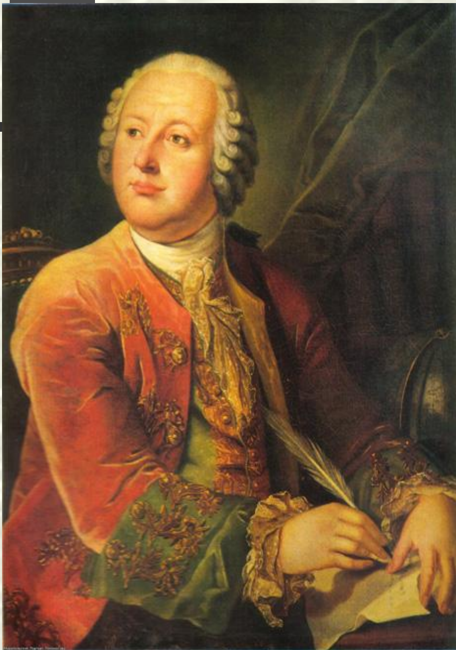
Л.С.Митропольский. Портрет М.В.Ломоносова (1787).