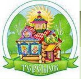
Схема осуществления проекта: