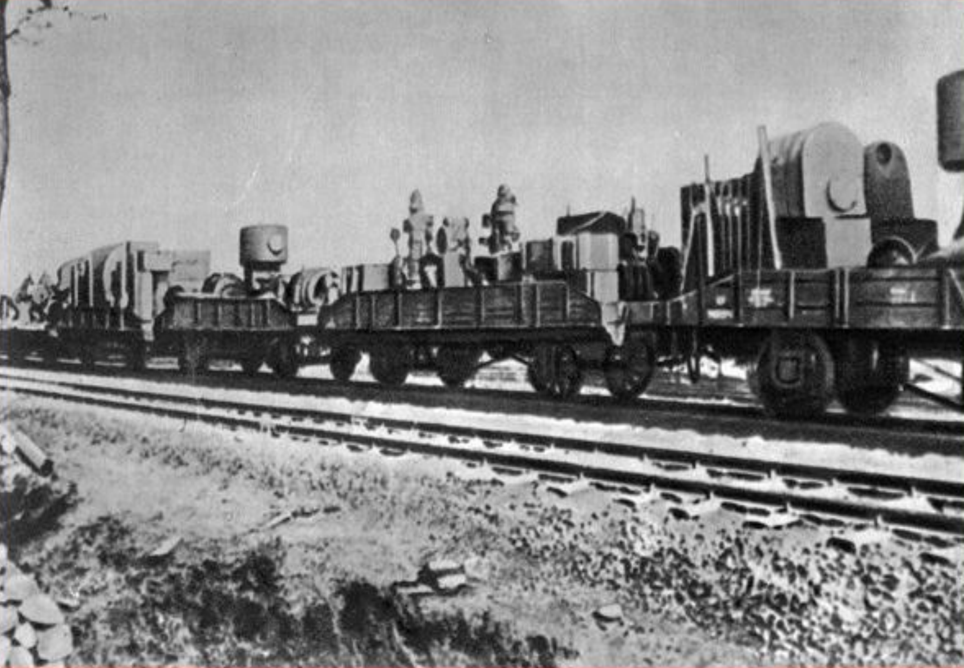
Эвакуация промышленных предприятий из Москвы