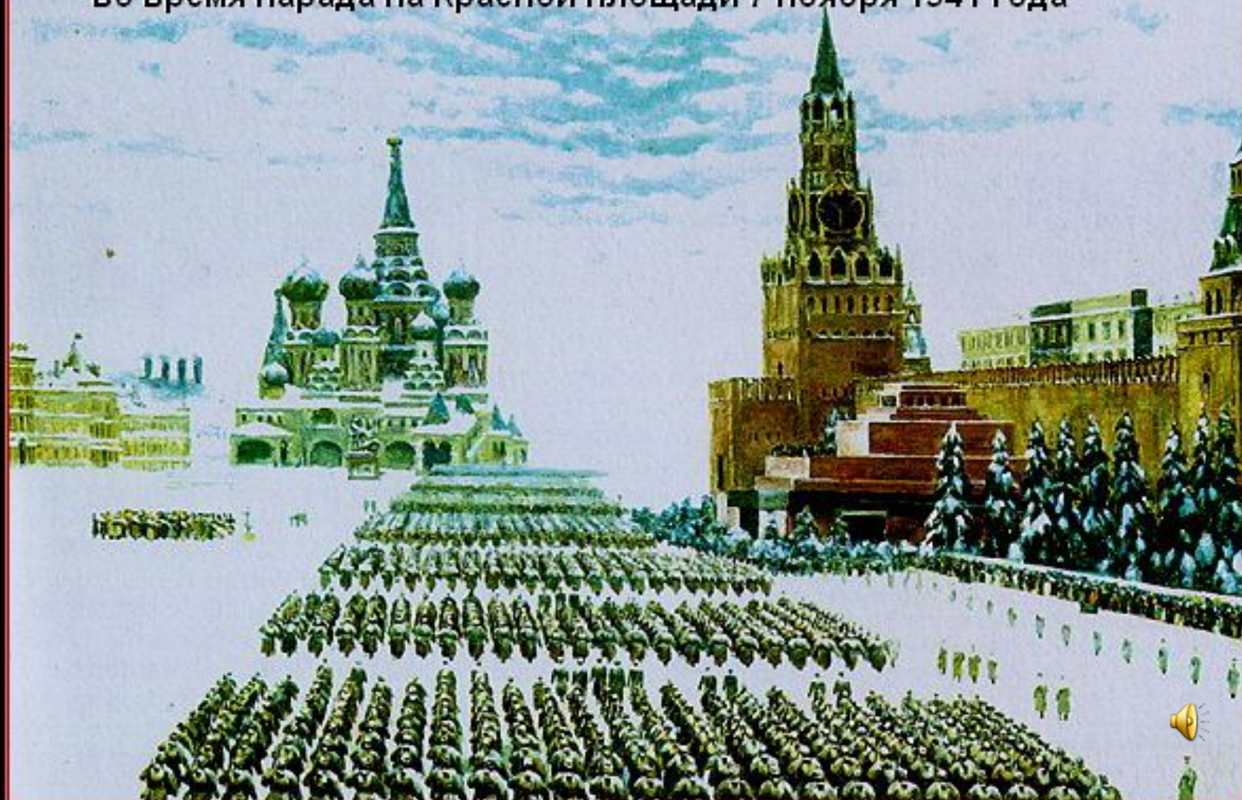
Парад Красной Армии 7 ноября 1941 года. Картина К.Юона

Речь Председателя ГКО, Верховного Главнокомандующего И.В.Сталина перед уходящими на защиту Москвы частями во время парада на Красной площади 7 ноября 1941 года