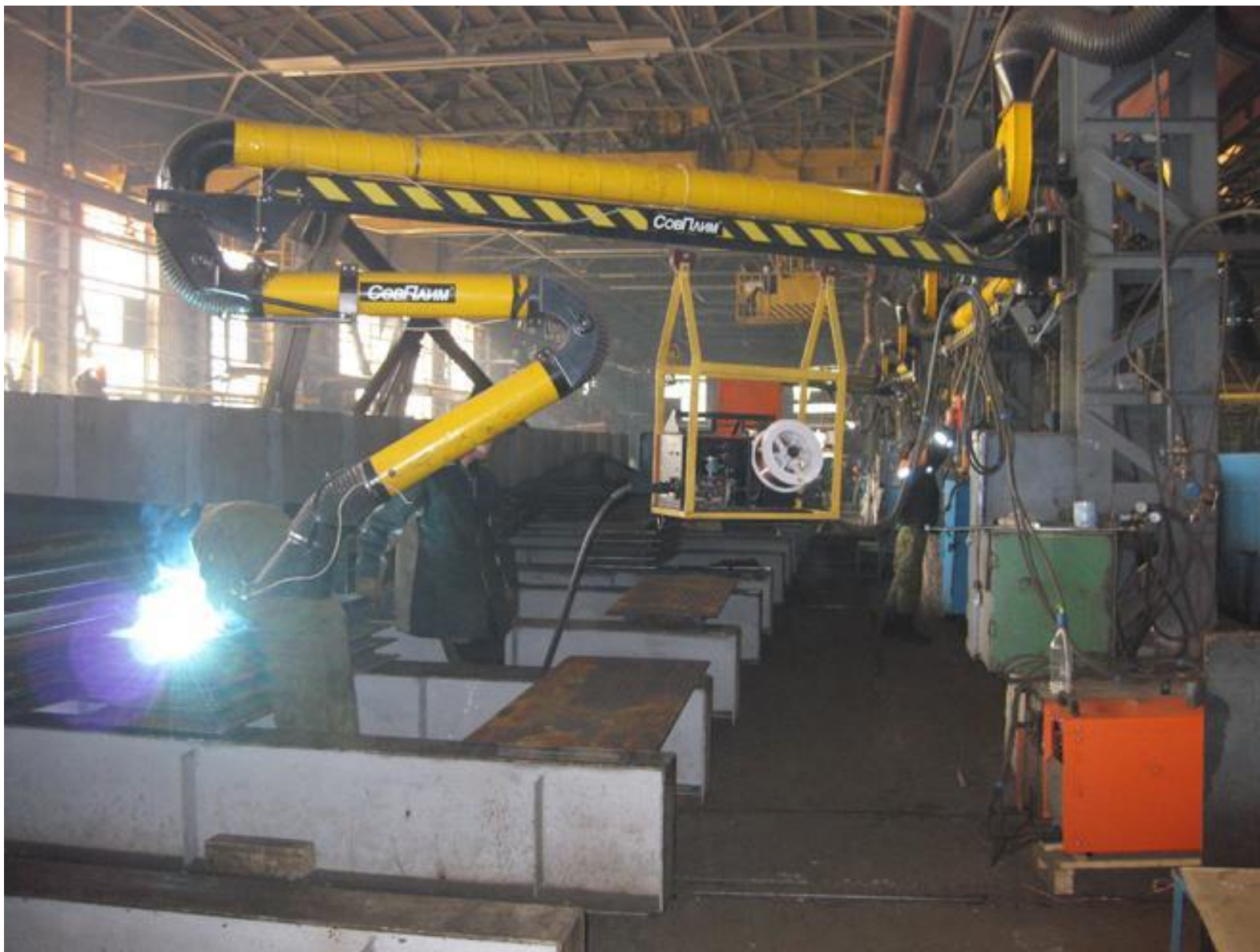
УЗМК ОАО «АК ВНЗМ»