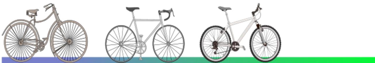
1885 безопасный велосипед Джон Кемп Старли Англия