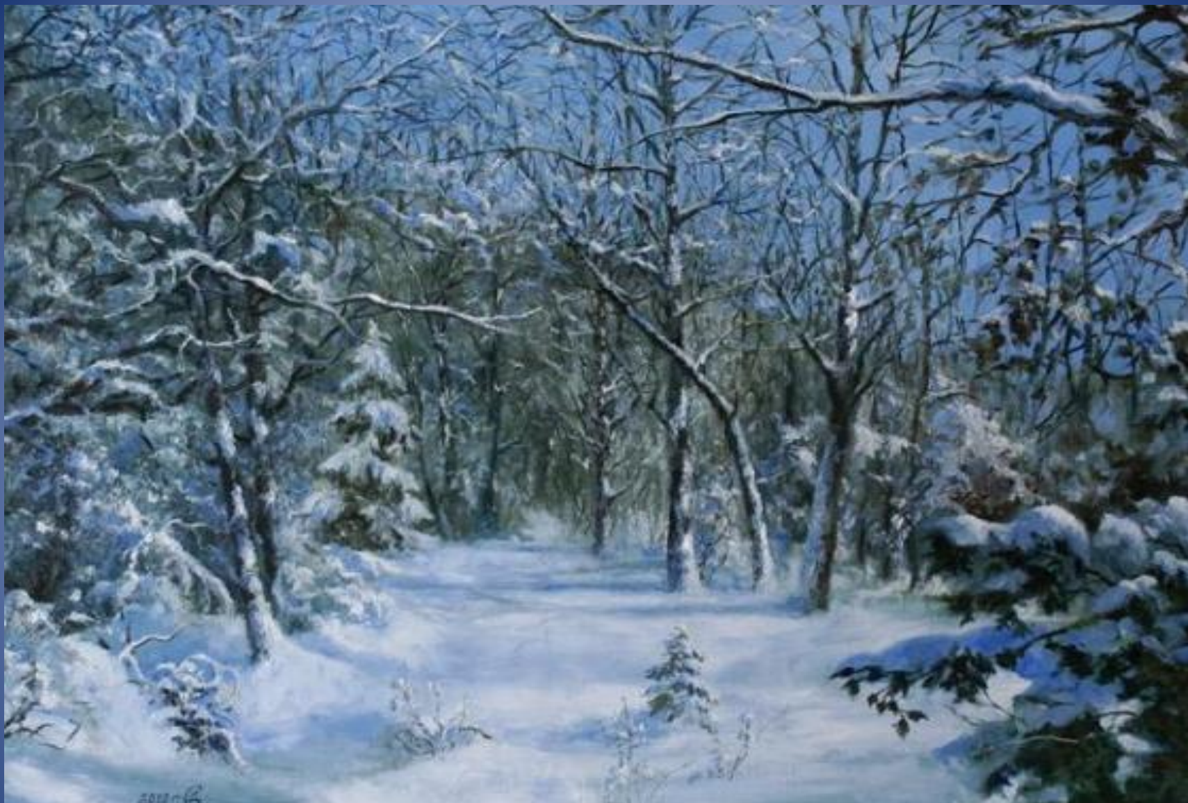
К. Ф. Юон «Зима»