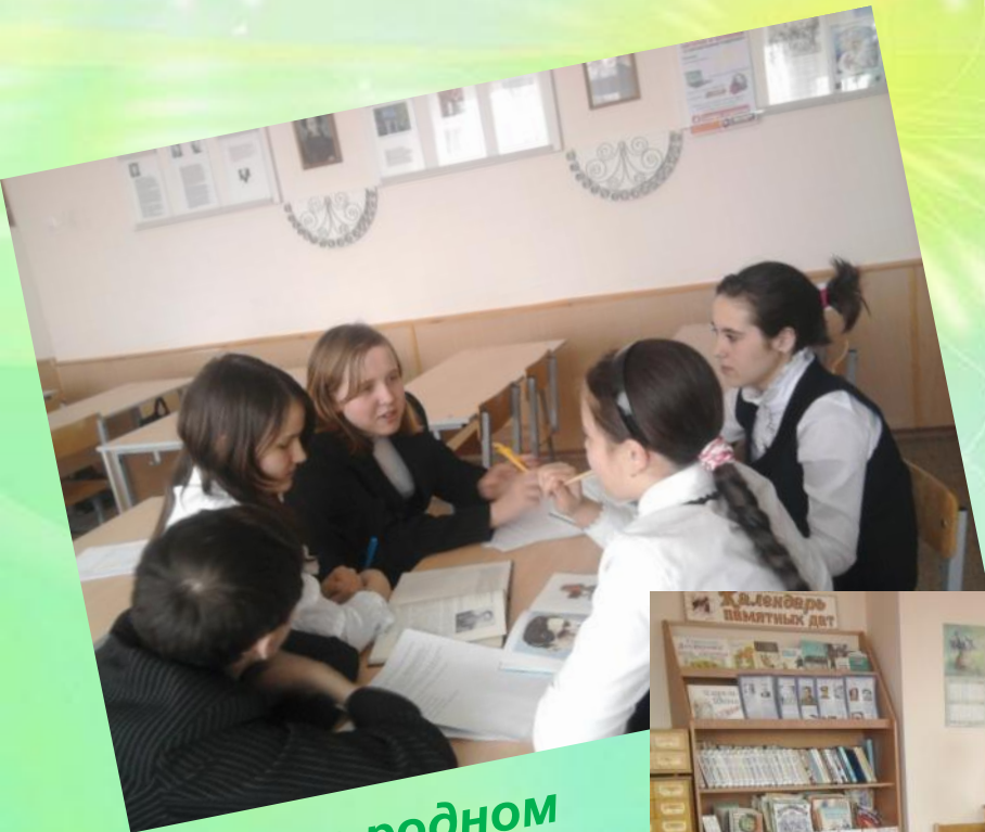
В книгах о родном городе