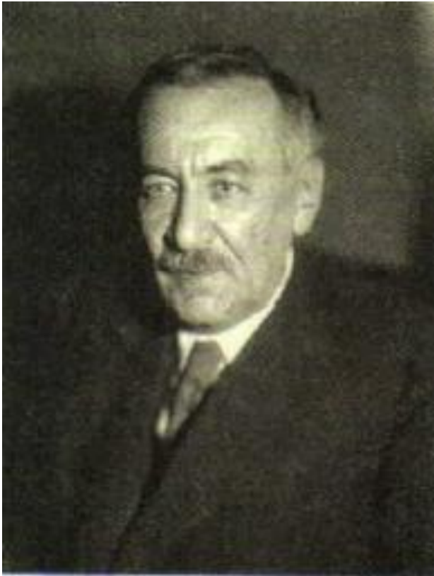
Мандельштам Леонид Исаакович (1879—1944) Российский физик, академик. Внёс существенный вклад в развитие радиофизики и радиотехники.