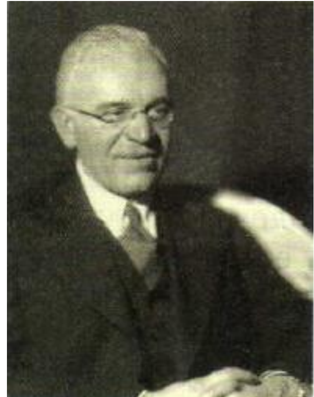
Папалекси Николай Дмитриевич (1880—1947) Российский физик, академик. Занимался исследованиями в области радиотехники, радиофизики, радиоастрономии.