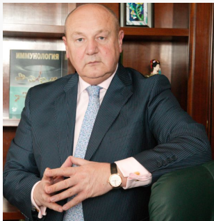
Gennady Sukhikh Director Academician of Russian Academy of Sciences

2, 800 employees 9 000 births 23 000 surgical procedures 20 operating rooms 18 labor wards 583 beds 24 laboratories 25 departments of different profiles 180 000 consultations per year > 1 000 000 tests