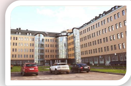
Clinical and Diagnostic Center