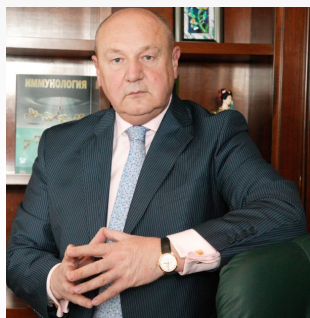
Gennady Sukhikh Director Academician of Russian Academy of Sciences

2, 800 employees 9 000 births 23 000 surgical procedures 20 operating rooms 18 labor wards 583 beds 24 laboratories 25 departments of different profiles 180 000 consultations per year > 1 000 000 tests