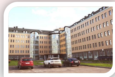
Clinical and Diagnostic Center