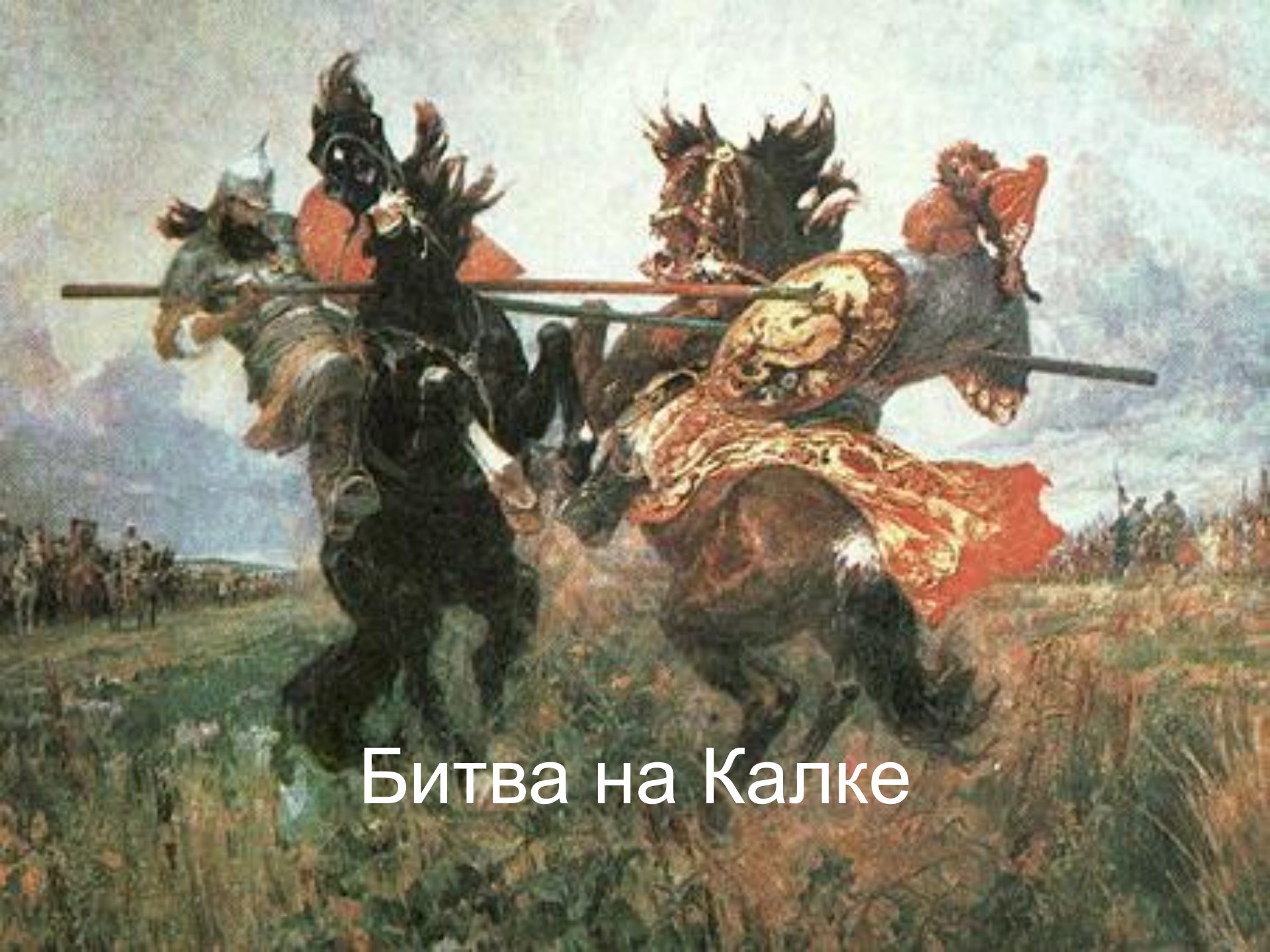
Битва на Калке