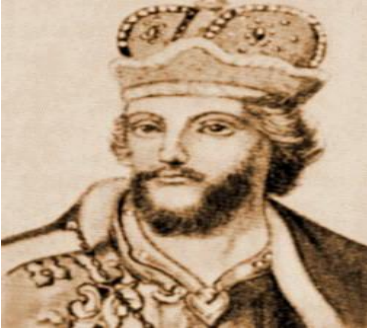
Александр Невский (1252-1263)