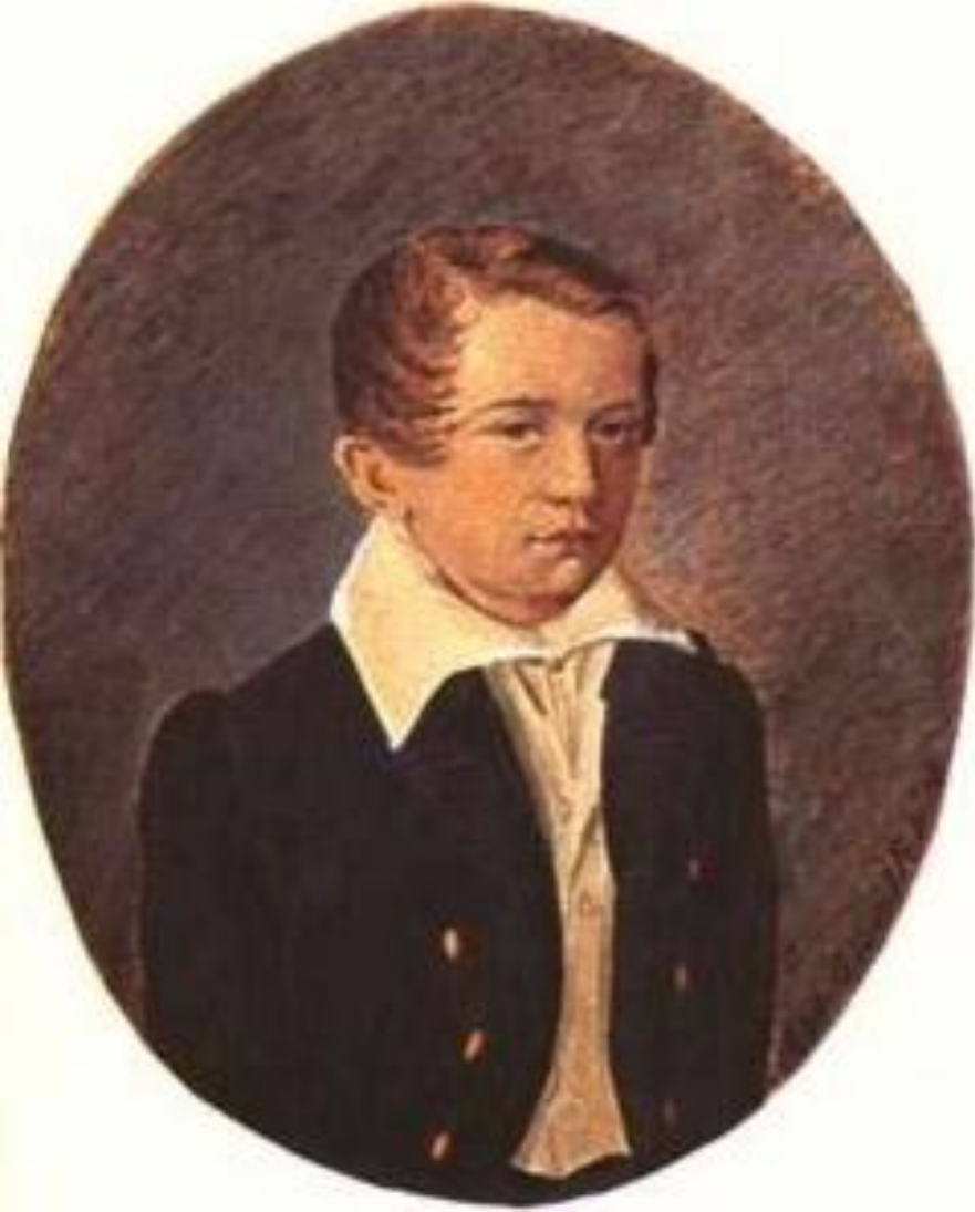
И.С. Тургенев в возрасте 12 лет.