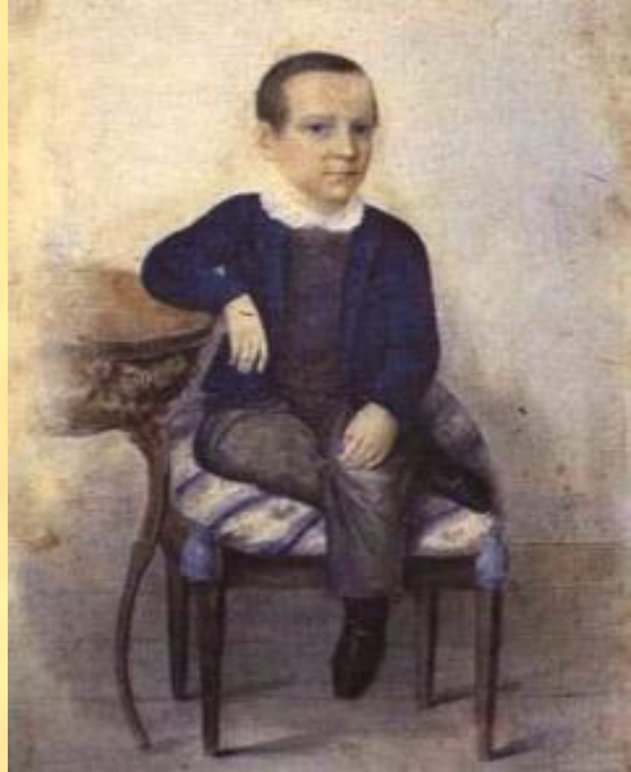
И.С. Тургенев в возрасте 7 лет